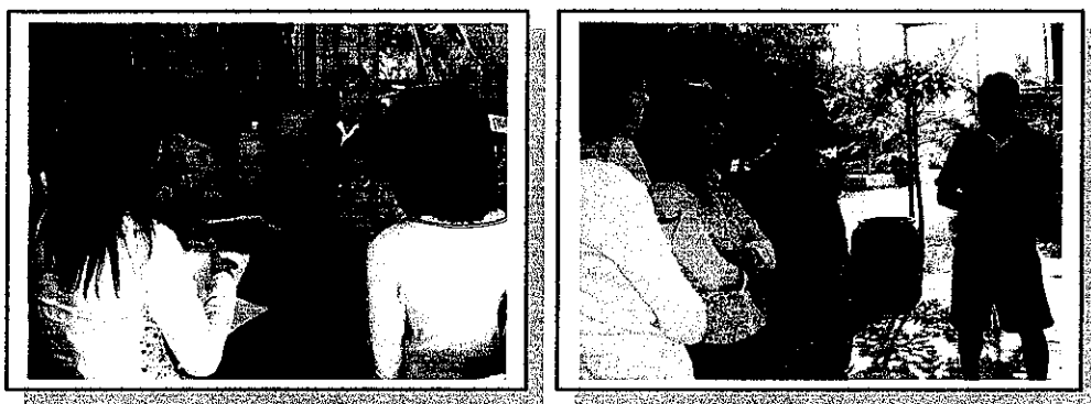
ภาพประกอบ 3-1 การเข้าสนามและสร้างสัมพันธภาพกับเจ้าของคอกเพาะเลี้ยงสุนัขบางแก้ว

หนึ่ง สำหรับระยะเวลาในการเข้าสนามวิจัยนั้น ผู้วิจัยใช้ระยะเวลาในการเข้าสนามวิจัยเป็นระยะเวลา 8 เดือน (เดือน สิงหาคม 2548 ถึง เดือน มีนาคม 2549) โดยใช้วิธีการเก็บข้อมูลแบบเข้าไปสังเกตการณ์แบบมีส่วนร่วมอย่างไม่สมมาตร การสัมภาษณ์และการสัมภาษณ์แบบเจาะลึกตามประเด็นที่ผู้วิจัยกำหนด การจดบันทึกภาคสนาม การศึกษาเอกสาร/สิ่งพิมพ์ บัญชีรายรับ-รายจ่าย รายละเอียดและผลการดำเนินงานของโครงการ นอกจากนี้ยังใช้อุปกรณ์ช่วยประกอบในการเก็บข้อมูล ได้แก่ กล้องถ่ายรูป เพื่อใช้บันทึกภาพเกี่ยวกับวิถีชีวิตของคนเลี้ยงสุนัขบางแก้ว และเครื่องบันทึกเสียงขนาดเล็ก เพื่อใช้บันทึกเสียงผู้ให้สัมภาษณ์ตามประเด็นต่างๆ ประกอบกัน