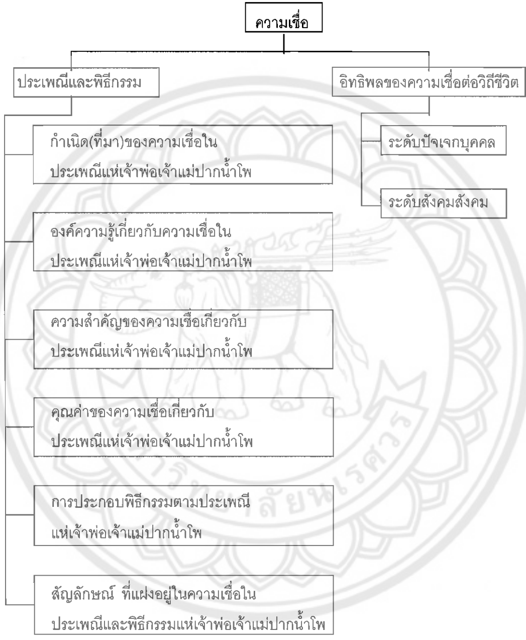
ภาพ 1 กรอบแนวคิดความเชื่อ