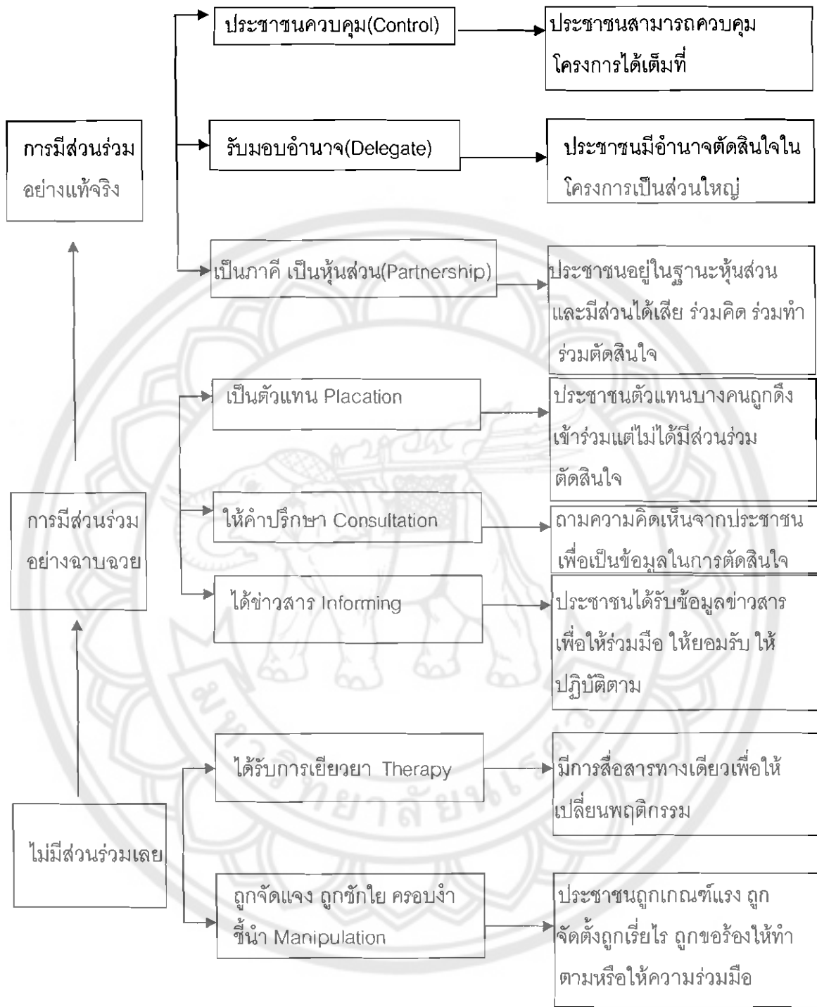
ที่มา : เอกสารประกอบการสัมมนาเชิงปฏิบัติการเรื่อง "การกระจายอำนาจ การดูแลสุขภาพ และการศึกษาสู่ประชาชน" (อุทัยวรรณ กาญจนกมล,2543)