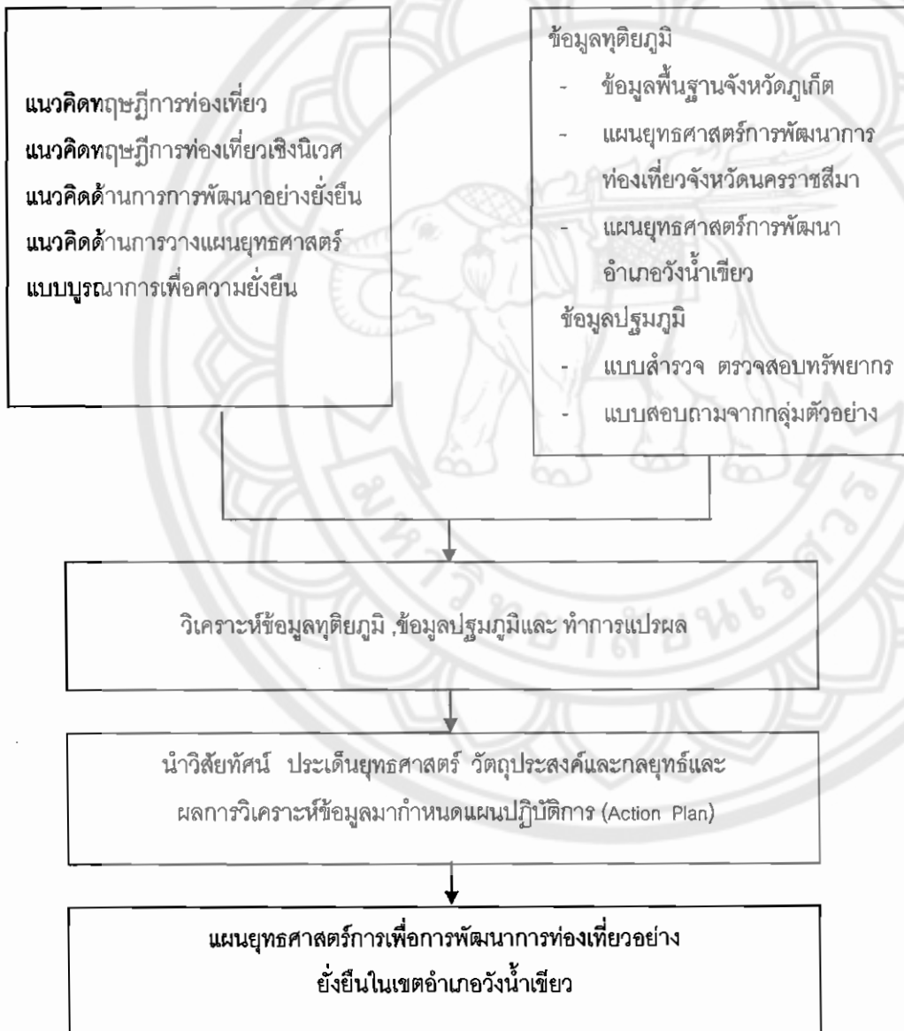
ภาพ 2 แสดงกรอบแนวคิดการวิจัย

จากการที่ผู้วิจัยได้ศึกษาค้นคว้าทฤษฎีแนวคิดและผลงานวิจัยที่เกี่ยวข้อง และเก็บรวบรวมข้อมูลจากการสำรวจและแบบสอบถามจากประชากรกลุ่มเป้าหมาย จึงได้กำหนดกรอบแนวคิดการวิจัย ดังนี้