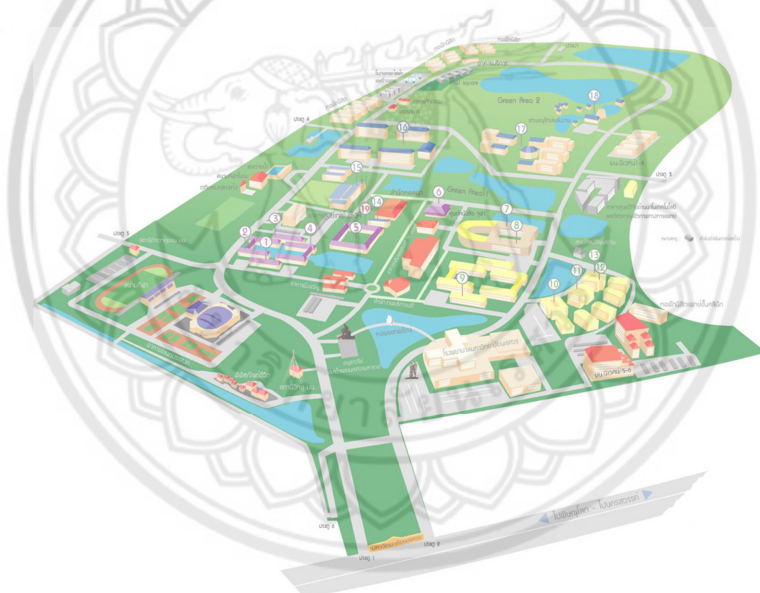
รูปที่ 1.1 แผนที่มหาวิทยาลัยนเรศวร

ความสะดวกได้อย่างทั่วถึงภายหลังจากโครงการรถไฟฟ้าของมหาวิทยาลัยนเรศวรได้ออกให้บริการมาแล้วระยะหนึ่ง ทางคณะผู้จัดทำวิจัยได้มีความสนใจที่จะศึกษาถึงความต้องการและความพึงพอใจของผู้ให้บริการรถไฟฟ้า ของมหาวิทยาลัยนเรศวร จังหวัดพิษณุโลก เช่น ช่วงเวลาการให้บริการ จำนวนรถที่ให้คอกยให้บริการว่ามารยาทของพนักงานขับรถ เส้นทางการเดินทาง เป็นต้น ข้อมูลที่ได้จากการศึกษาในครั้งนี้ จะทำให้เราทราบถึงความต้องการและความพึงพอใจ ของนิสิตและบุคลากรทั่วไปที่มีต่อการใช้บริการรถไฟฟ้า รวมทั้งแนวทางในการแก้ไข และข้อบกพร่องต่างๆ ในการให้บริการรถไฟฟ้า ซึ่งเป็นประโยชน์อย่างยิ่งต่อทางมหาวิทยาลัยที่จะใช้ในการแก้ไขปรับปรุงข้อบกพร่องต่างๆ ที่เกี่ยวข้อง ให้ดีขึ้น ซึ่งจะนำมาซึ่งประสิทธิภาพในการให้บริการรวมไปถึงความปลอดภัยต่างๆ