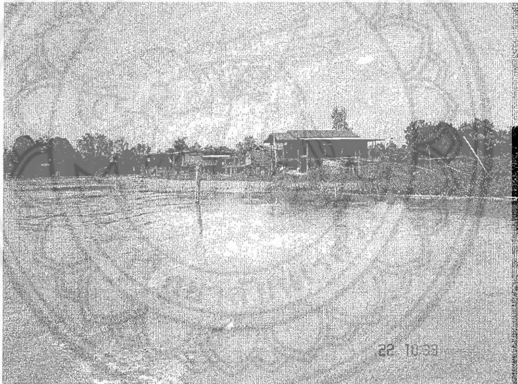
ภาพ 4 ลุ่มน้ำยมที่มีกระแสน้ำแรงและสภาพเกาะแก่งบริเวณชุมชนบ้านกง

เนื่องจากลำน้ำยมนั้นมีสาขาหลากหลาย คนในอดีตจึงได้อาศัยลำน้ำยมนี้นในการเดินทางเป็นหลัก และนอกจากจะใช้เพื่อการสัญจรแล้ว ยังใช้ประโยชน์ในทางการค้าด้วย โดยเฉพาะในหน้าน้ำ แต่ก็ไม่ถือง่ายนักเพราะผู้ที่เดินทางสัญจรไปมาจะต้องเป็นผู้ที่มีความชำนาญในการเดินเรือ และแข็งแรง เพราะไม่เช่นนั้นนั้นอาจเกิดอุบัติเหตุและอันตรายได้ง่าย เนื่องจากกระแสน้ำแรงและสภาพเกาะแก่งมีให้เห็นโดยทั่วไป ประกอบกับมีกระแสน้ำวนด้วย