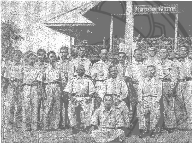
ภาพ 2 ข้าราชการของอำเภอองไกรลาศถ่ายภาพร่วมกัน ณ ที่ว่าการอำเภอองไกรลาศหลังเก่า

(ราชบัณฑิตยสถาน, อักษรานุกรมภูมิศาสตร์ เล่ม 2 หน้า 2, อ้างอิงในคณะกรรมการฝ่ายประมวลเอกสารและจดหมายเหตุ, 2542, หน้า 8) จึงได้ย้ายไปใช้ห้องสมุดประชาชนอำเภอองไกรลาศเป็นที่ทำการชั่วคราว ซึ่งตรงกับสมัยที่นายเชื้อม ศิริสนธิ ดำรงตำแหน่งผู้ว่าราชการจังหวัดสุโขทัย ที่ว่าการอำเภอองไกรลาศในปัจจุบันนี้ มีเนื้อที่ทั้งหมด 25 ไร่ ที่ว่าการอำเภอองไกรลาศหันหน้าไปทางทิศเหนือ ซึ่งต่อมาทางราชการได้ใช้งบประมาณสร้างอาคารที่ว่าการอำเภอองไกรลาศแล้วเสร็จเมื่อพุทธศักราช 2507