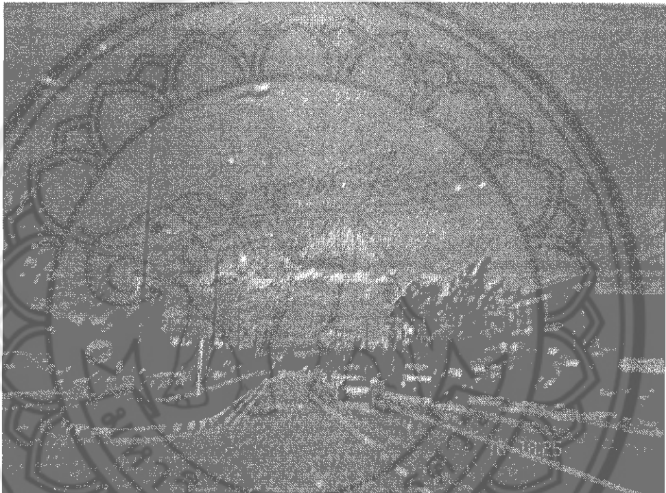
ภาพ 5 เส้นทางคมนาคมในอำเภอองไกรลาศในอดีตเป็นถนนคอนกรีต 2 ช่องการจราจร