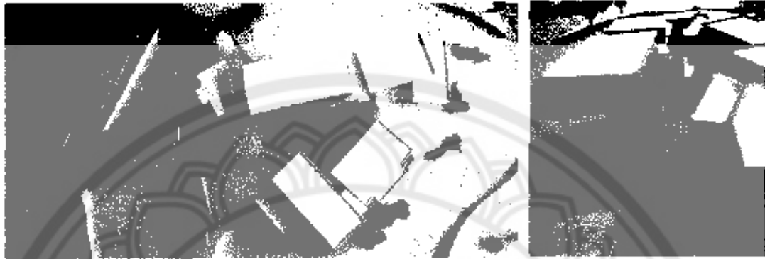
รูปที่ 113 แบบจำลองโครงการ

โครงการศูนย์การเรียนรู้ศิลปประเพณีแสดงพื้นบ้านอีสาน เป็นการศึกษาข้อมูลเพื่อการออกแบบสถาปัตยกรรมตอบสนองตามความต้องการที่ได้สังเคราะห์จากสภาพความเป็นอยู่ในปัจจุบันของคนอีสาน เพื่อเป็นทางเลือกสำหรับการแสดงออกในด้านสังคมวัฒนธรรม โดยการศึกษาผ่านสื่อที่เห็นได้เด่นชัดและเข้าใจง่าย คือ ศิลปะการแสดงพื้นบ้าน อันมีเอกลักษณ์ที่โดดเด่น ชัดเจน และเป็นแบบจำลองกิจกรรมที่เกิดขึ้นในภูมิภาคอีสาน สะท้อนความเป็นวิถีชีวิต สังคม วัฒนธรรมอีสานออกมา ในการศึกษาเพื่อทำวิทยานิพนธ์ในครั้งนี้ ได้ทดลองนำเอาการแสดงพื้นบ้าน มาเป็นเครื่องมือในการที่จะถ่ายทอดความรู้ความเข้าใจ ให้กับคนภายนอกได้รับรู้ อย่างถูกต้อง เกี่ยวกับภาวะความเป็นอีสาน ตัวโครงการแสดงออกเป็นรูปแบบทางสถาปัตยกรรม โดยมีแนวความคิดในการนำเอารูปแบบการใช้พื้นที่ว่าง กิจกรรมที่เป็นอยู่ในชีวิตประจำวันของคนอีสานมาใช้ผสมผสานกับพื้นที่ใช้สอยที่ถูกกำหนดขึ้นตามวัตถุประสงค์และลักษณะของโครงการ รวมถึงการออกแบบให้เหมาะสมกับสภาพพื้นที่ตั้งโครงการ โดยให้เป็นส่วนหนึ่งของพื้นที่เดิม ซึ่งเป็นสวนสาธารณะ เพื่อให้เกิดความต่อเนื่องระหว่างการใช้พื้นที่และกิจกรรมที่เป็นอยู่เดิม แต่ในการศึกษาของโครงการยังขาดความเป็นเอกลักษณ์ที่ชัดเจนของอีสานซึ่งยังไม่ได้มีการศึกษารูปแบบทางสถาปัตยกรรมพื้นถิ่นเท่าที่ควร ผลการออกแบบจึงไม่ได้บ่งบอกให้เห็นว่า นี่คือ สถาปัตยกรรมที่ต้องการสื่อถึงความเป็นอีสาน