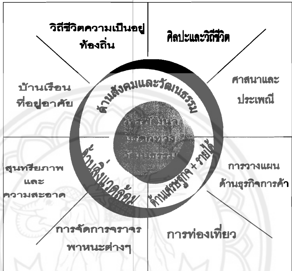
ภาพ 2 การพัฒนาการท่องเที่ยวเชิงวัฒนธรรม

หลักการในการอนุรักษ์ทรัพยากรการท่องเที่ยวทางวัฒนธรรม มีดังนี้