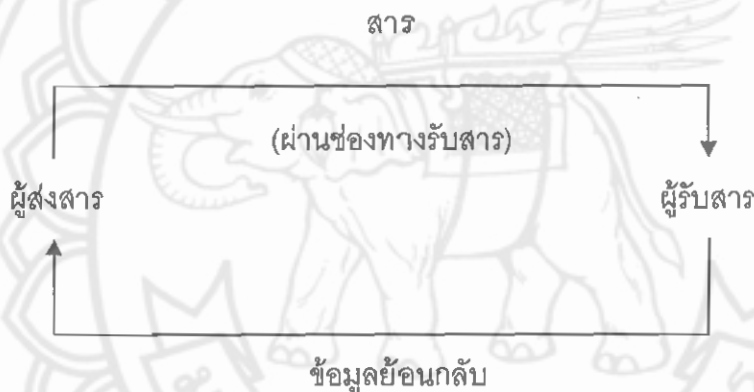
ภาพ 2 ความสัมพันธ์ระหว่างผู้ส่งสาร สาร และผู้รับสาร (Friedman, 1983 : 111)

องค์ประกอบสำคัญของการสื่อสาร ได้แก่ 1) ผู้ส่งสาร หมายถึง บุคคลที่จะส่งสารไปให้กับบุคคลอื่น 2) สาร หมายถึง สิ่งเร้าหรือสาระที่ผู้ส่งสารต้องการให้ผู้อื่นได้รับรู้ 3) ช่องทางรับสาร หมายถึง วิธีการที่ผู้ส่งสารติดต่อกับผู้รับสารได้ เช่น การได้ยิน การอ่าน การได้กลิ่น การรู้รส เป็นต้น 4) ผู้รับสาร หมายถึง ผู้ที่เป็นเป้าหมายที่สารส่งถึง ความสัมพันธ์ระหว่างผู้ส่งสาร สาร ช่องทางรับสาร และผู้รับสาร สามารถแสดงได้ดังนี้