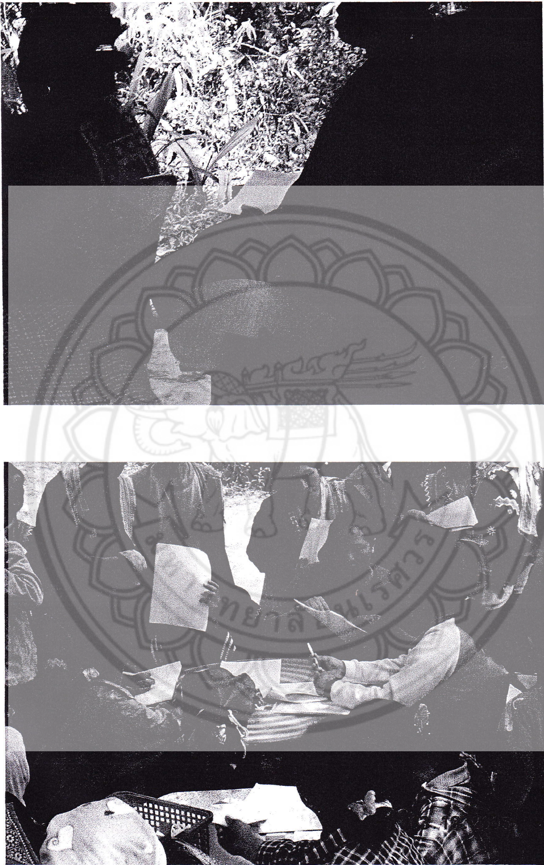
ภาพ 3 การตรวจสอบข้อมูลการวิเคราะห์หัตถ์ของของกลุ่มอมมทรัพย์สตรี