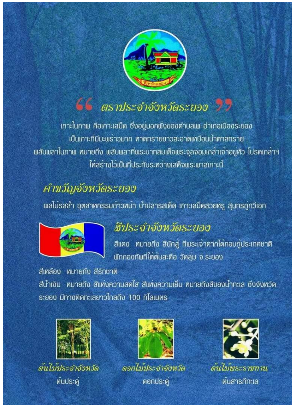
ภาพ 43 แสดงสภาพทั่วไปของจังหวัดระยอง