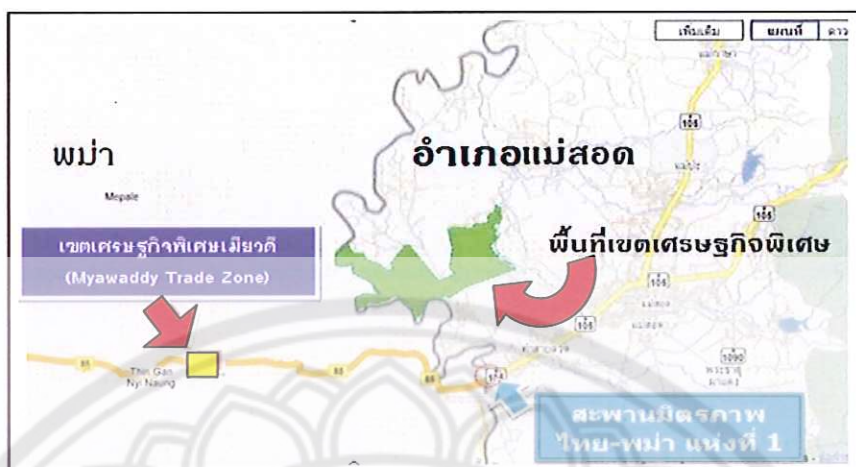
ภาพ 2 แสดงขอบเขตพื้นที่จัดตั้งเขตเศรษฐกิจพิเศษแม่สอดโดยสังเขป