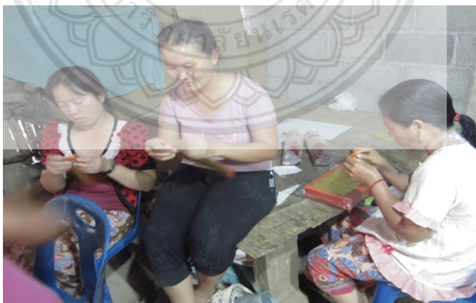
ภาพ: กลุ่มแม่บ้านช่วยกันปักกระดาษเงินกระดาษทอง