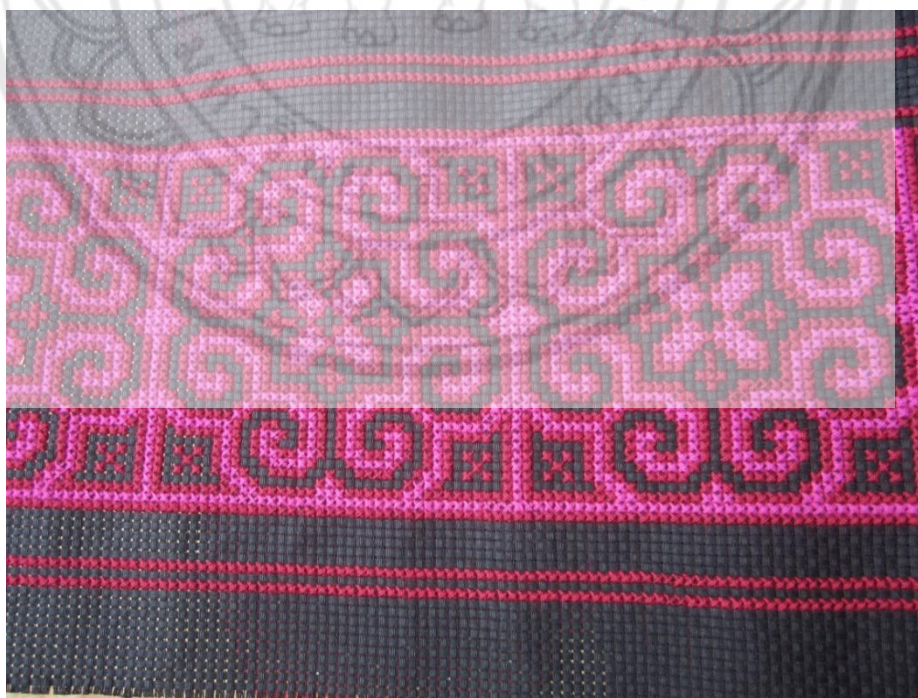
ภาพ:ผ้าปักของชาวเขาเผ่าม้งบ้านสบเป็ด