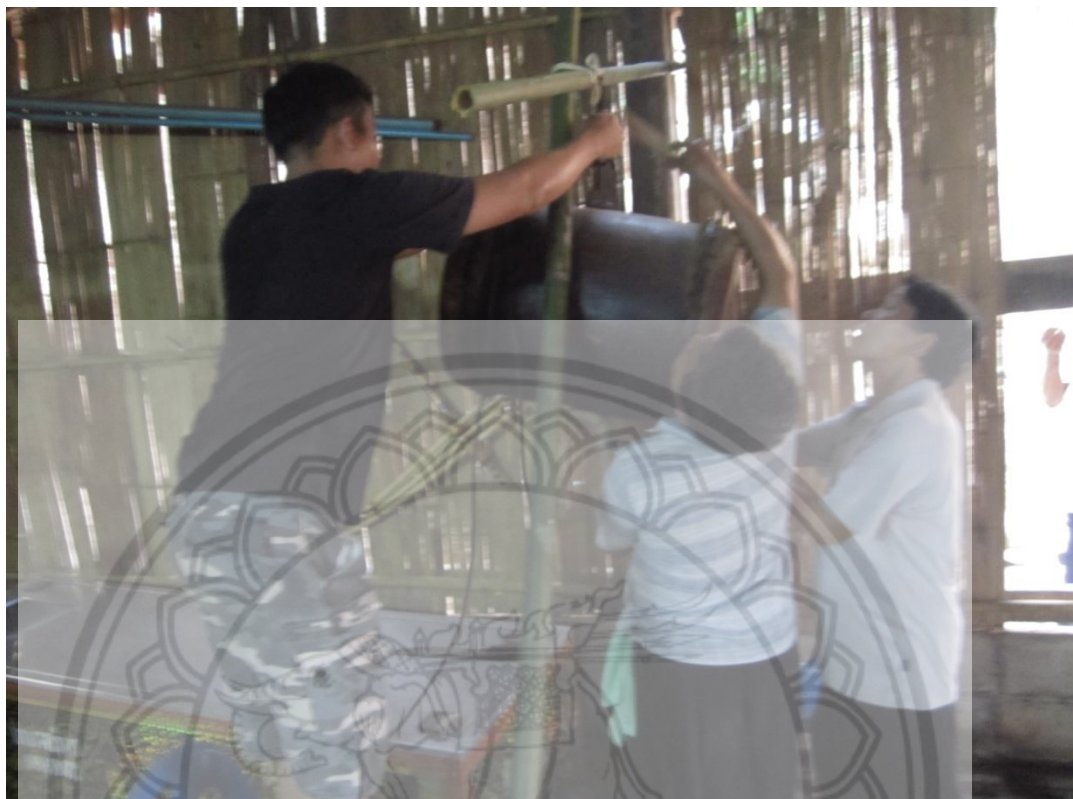
ภาพ:ชาวบ้านช่วยกันยกกลองหรือจั่วขึ้นแขวน