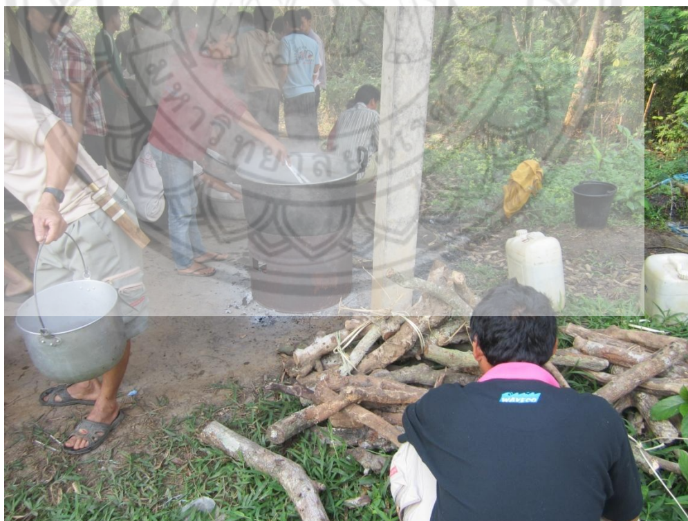
ภาพ:การประกอบอาหารเพื่อต้อนรับผู้ร่วมงานศพ