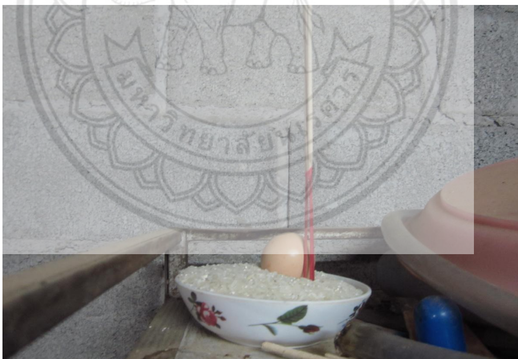
ภาพ: อุปกรณ์ที่ใช้เรียกขวัญ