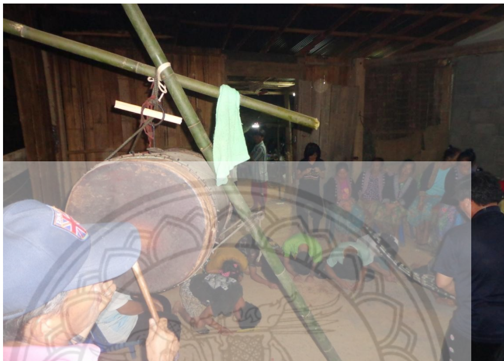
ภาพ:ลักษณะการแขวนกลองในพิธีกรรมศพ