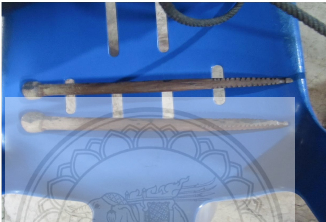
ภาพ:ไม้ตีกลอง หรือ จี่วะ