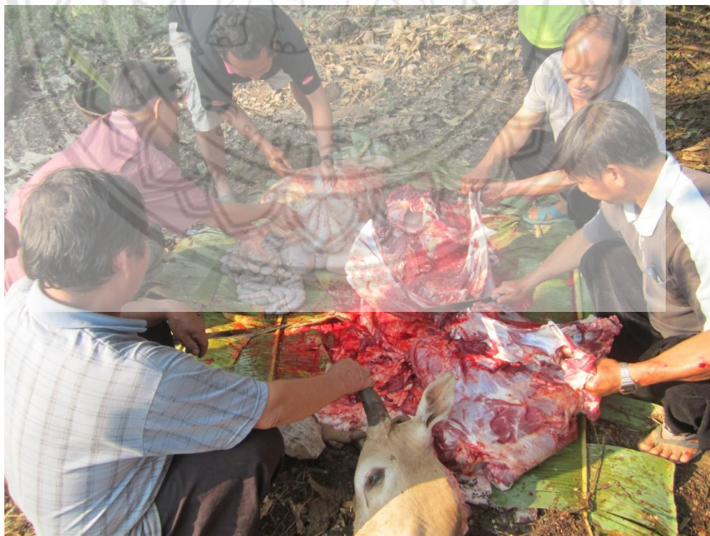
ภาพ: การฆ่าวัวเพื่อให้ดวงวิญญาณของผู้ตายได้รับ