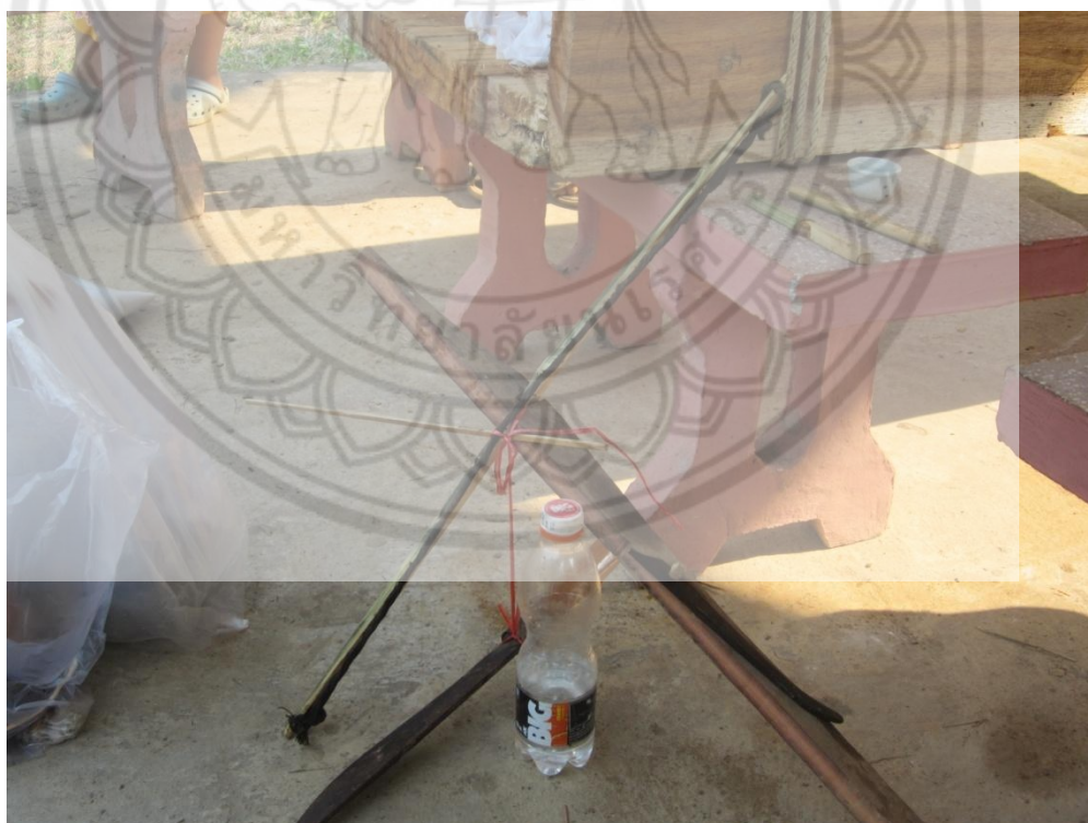
ภาพ:ลักษณะของเน็งเต้า