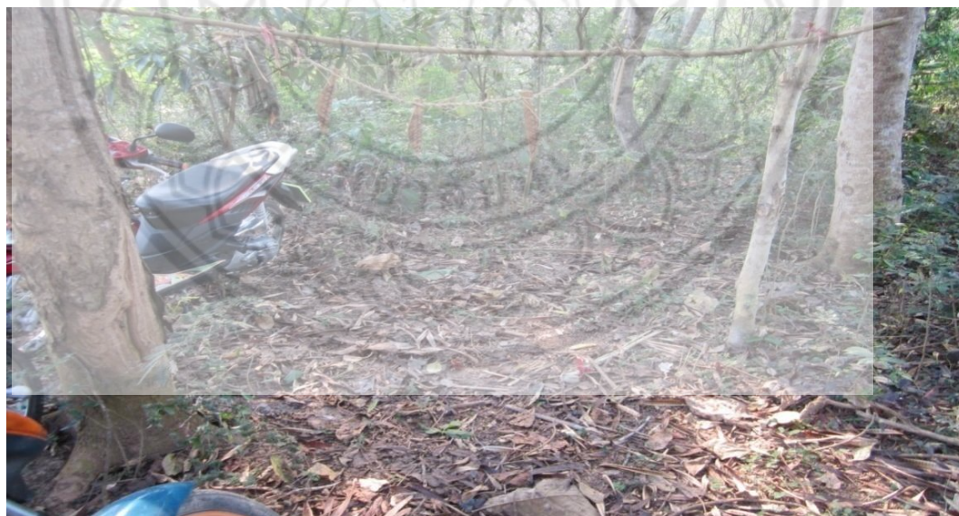
ภาพ:การไปเรียกดวงวิญญาณผู้ตายจากบริเวณที่เสียชีวิต