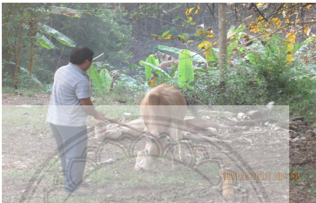
ภาพ: การฆ่าวัวในพิธีกรรมศพ