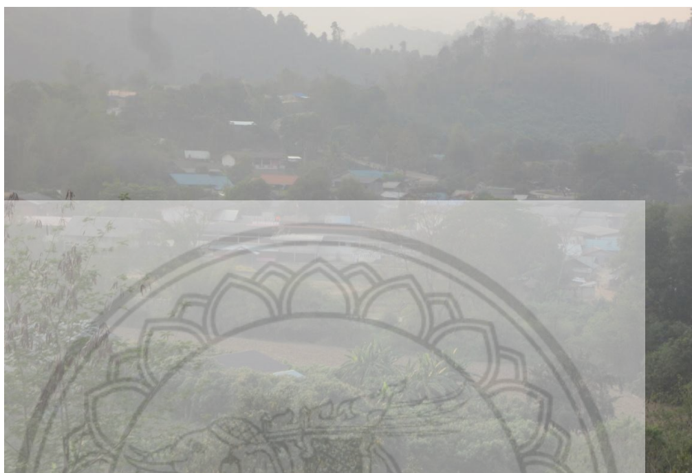
ภาพ:สภาพทั่วไปของหมู่บ้าน