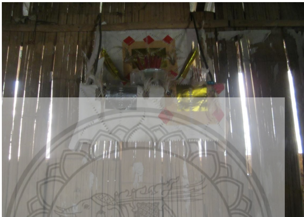
ภาพ:กระดาดเงินกระดาดทองที่เชื่อว่าช่วยคุ้มครองสมาชิกในบ้าน