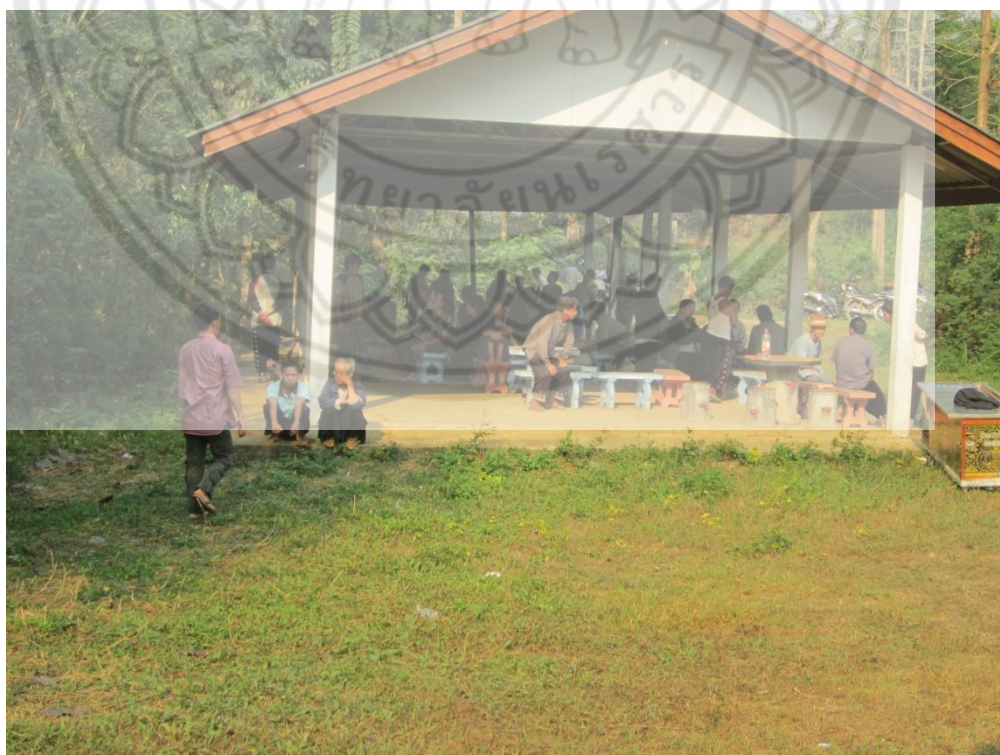
ภาพ:ชาวบ้านมารวมกันทำพิธีที่สุสานประจำหมู่บ้าน