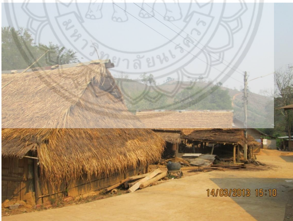
ภาพ:ลักษณะการตั้งบ้านเรือน