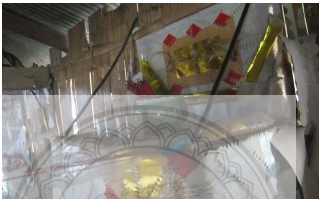
ภาพ:ลักษณะของท่าเน็ง