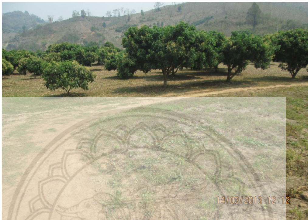
ภาพ:ไร่มะม่วง การเกษตรอาชีพหลักของคนในชุมชน