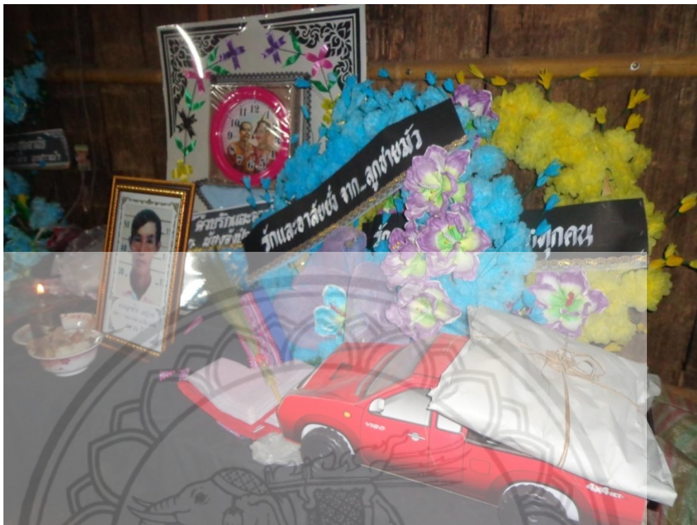
ภาพ: สิ่งของสำหรับไว้อาลัยผู้ตาย