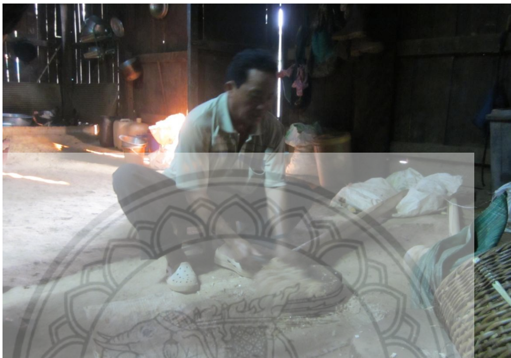
ภาพ:การสับต้นกล้วยเพื่อเป็นอาหารเลี้ยงสุกร