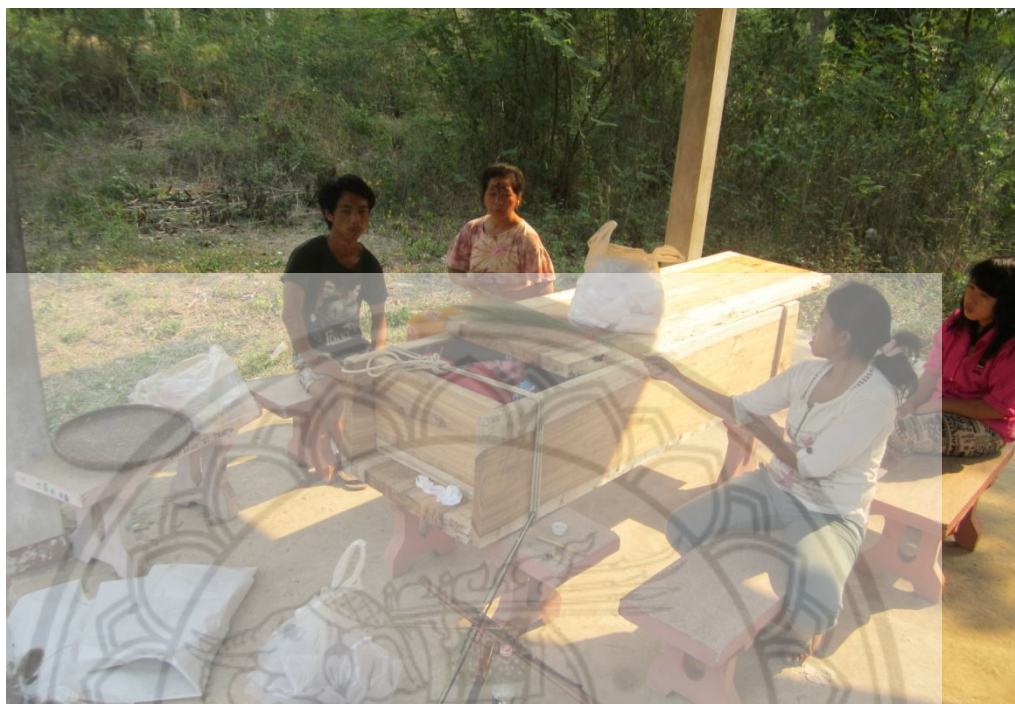
ภาพ:ลักษณะโรงศพ