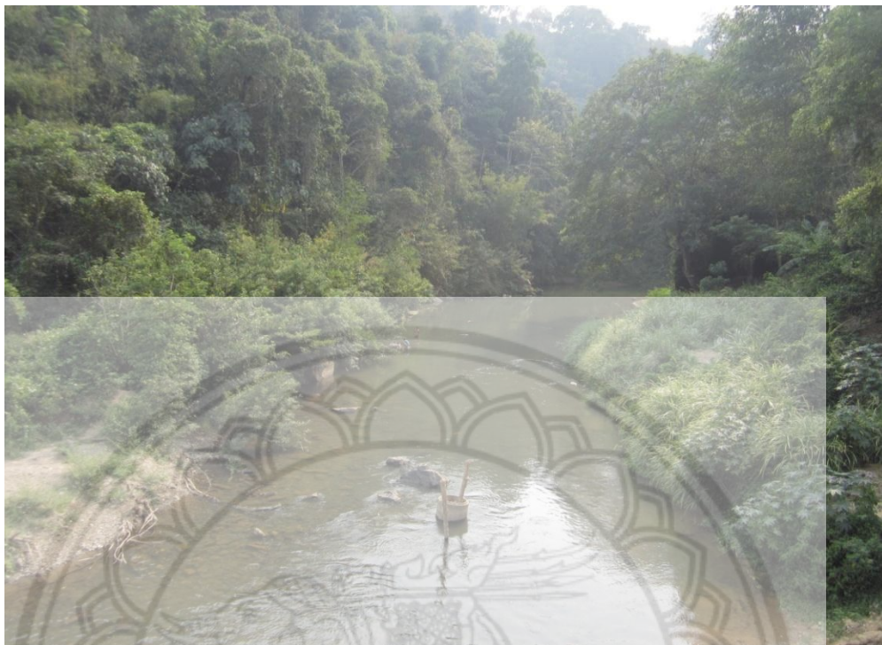
ภาพ:แม่น้ำยาวแม่น้ำสายหลักของหมู่บ้าน