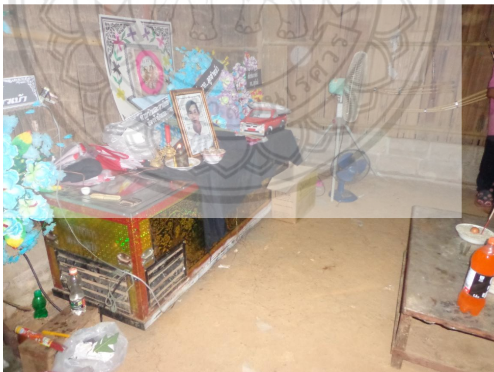
ภาพ: ลักษณะการตั้งโรงศพ