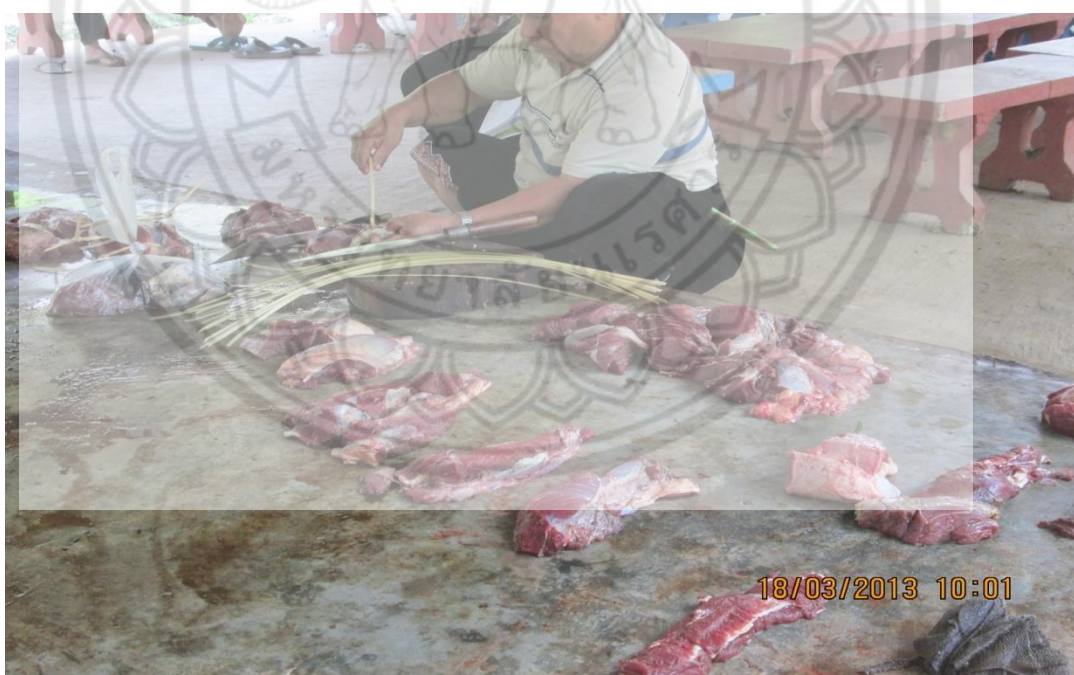
ภาพ: การแบ่งเนื้อวัวให้กับคนที่ฆ่าวัว