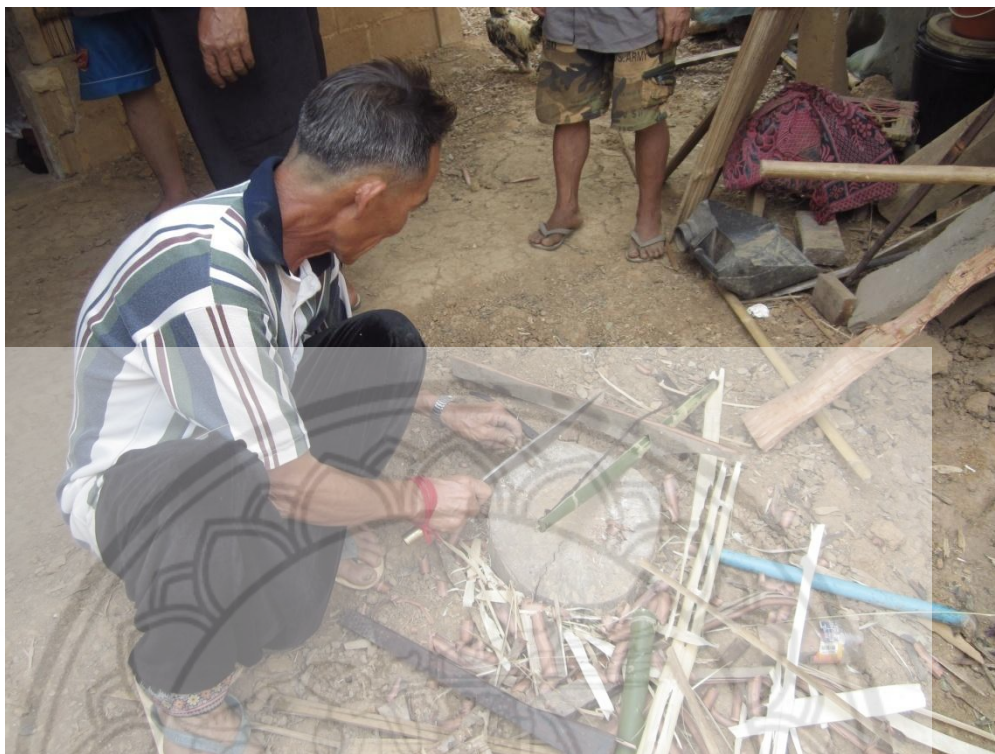
ภาพ:การทำเน้งเต้า