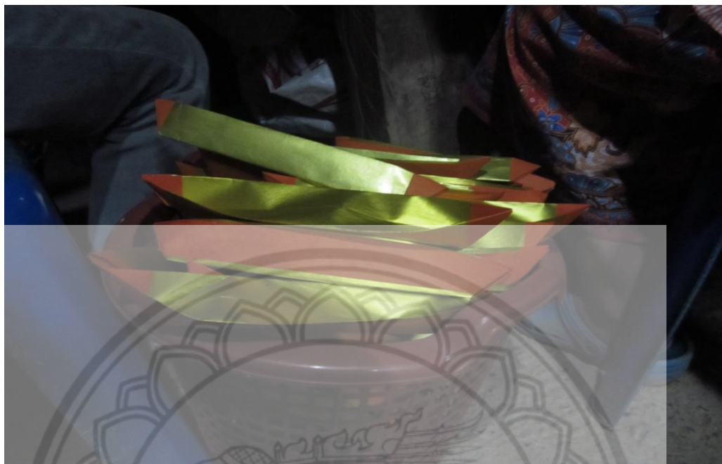
ภาพ: กระดาษเงินกระดาษทอง