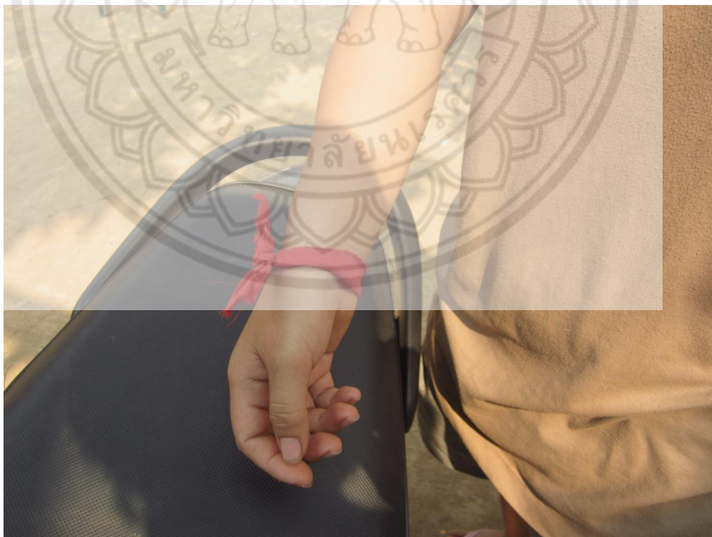
ภาพ:ลักษณะของผ้าแดงที่ใช้ผูกมือญาติผู้ตาย