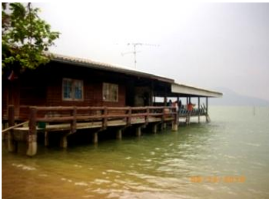
ภาพ 6 แสดงลักษณะบ้านในชุมชนเกาะพิทักษ์

... เราอยู่กันอย่างเรียบง่าย ไม่มีเครื่องปรับอากาศ พัดลมก็มีเพียงตัวเดียว เพราะทุกคนนอนด้วยกัน มีเรือจอดไว้ใกล้บ้าน เหมือนในเมืองเขามือรถยนต์จอดไว้ข้างบ้าน แต่เรามีเรือ... (สมพร รัตนราช, ผู้ให้สัมภาษณ์, 5 ธันวาคม 2553)