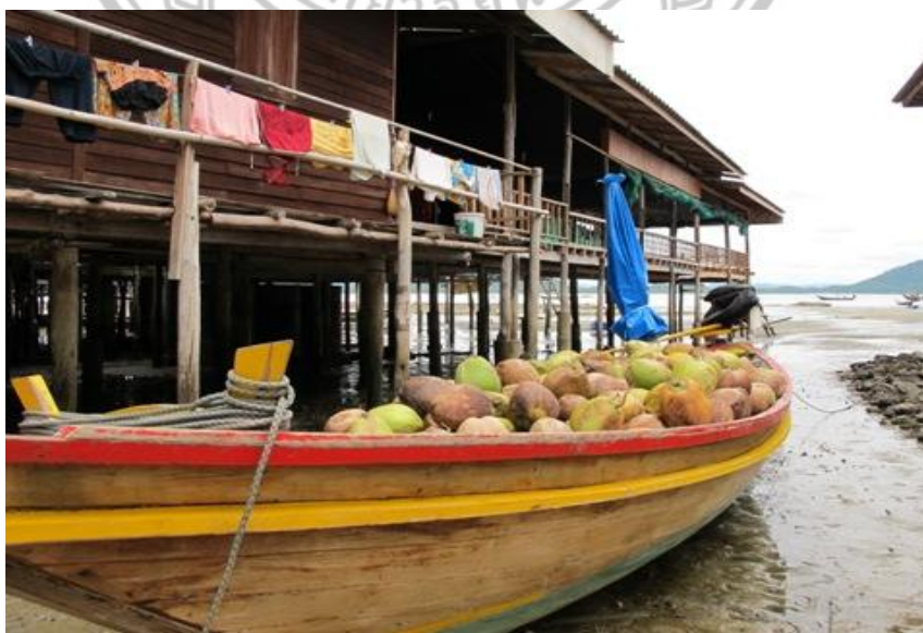
ภาพ 21 แสดงการนำมะพร้าวไปขาย

นอกจากการเรียนรู้วิถีชีวิตทางด้านการประมงพื้นบ้านแล้ว ชุมชนเกาะพิทักษ์ยังเปิดโอกาสให้นักท่องเที่ยวได้มีโอกาสชมการเผามะพร้าวนำส่งบนฝั้งเพื่อทำน้ำมันมะพร้าวแต่การเผาที่จะทำการขายทั้งลูกแต่ถ้ามะพร้าวเผาแพงกว่ามะพร้าวที่เป็นลูกก็จะขายแบบเผาแล้ว เพราะส่วนใหญ่พื้นที่รอบเกาะพิทักษ์เป็นสวนมะพร้าว