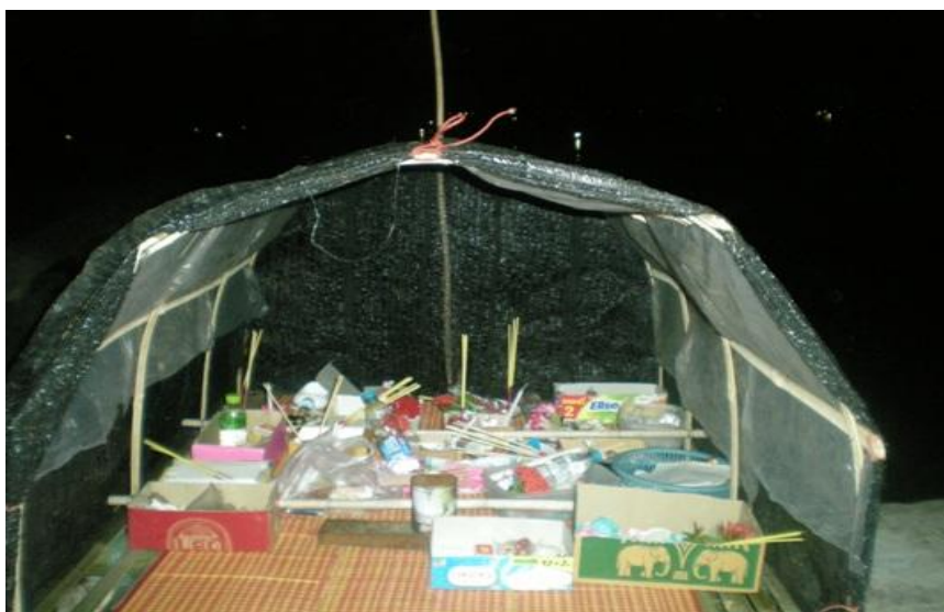
ภาพ 11 แสดงพิธีสวดหาดลอยแพ