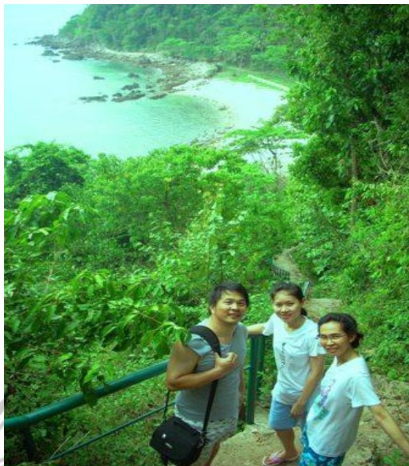
ภาพ 22 แสดงธรรมชาติรอบเกาะพิทักษ์