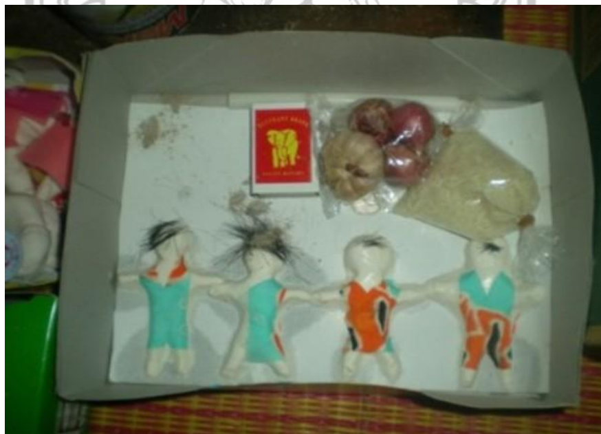
ภาพ 12 แสดงตุ๊กตาและสิ่งของที่ใช้ในพิธีสวดหาดลอยแพ