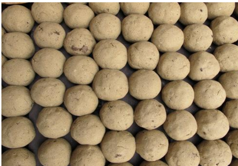
ภาพ 35 แสดงจุลินทรีย์บอลล