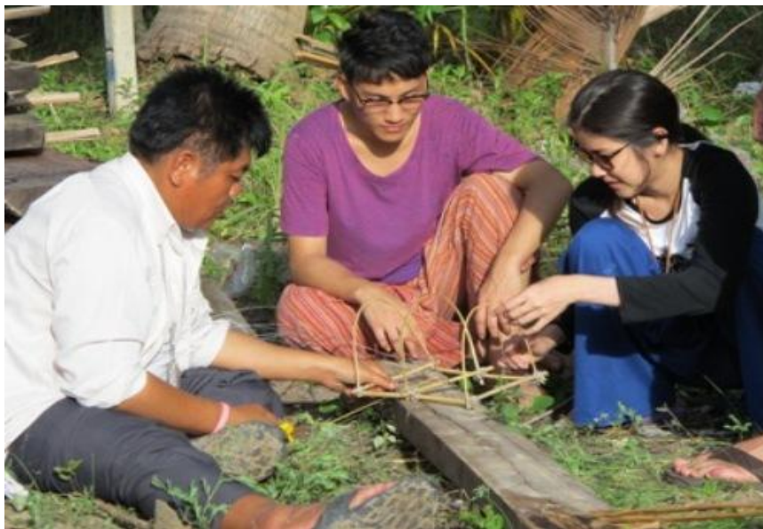
ภาพ 20 แสดงนักท่องเที่ยวมีส่วนร่วมในการเรียนรู้วิถีชีวิต

นอกจากการเรียนรู้วิถีชีวิตทางด้านการประมงพื้นบ้านแล้ว ชุมชนเกาะพิทักษ์ยังเปิดโอกาสให้นักท่องเที่ยวได้มีโอกาสชมการเผามะพร้าวนำส่งบนฝั้งเพื่อทำน้ำมันมะพร้าวแต่การเผาที่จะทำการขายทั้งลูกแต่ถ้ามะพร้าวเผาแพงกว่ามะพร้าวที่เป็นลูกก็จะขายแบบเผาแล้ว เพราะส่วนใหญ่พื้นที่รอบเกาะพิทักษ์เป็นสวนมะพร้าว