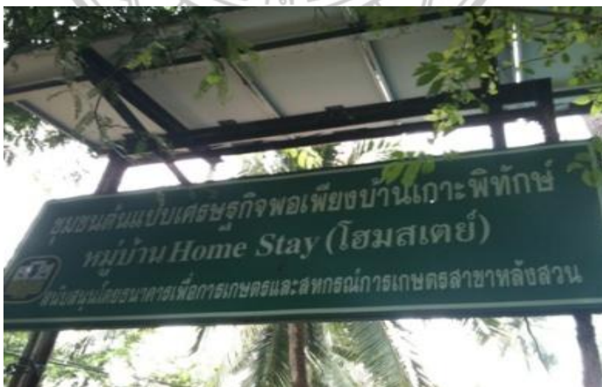
ภาพ 8 แสดงป้ายชุมชนต้นแบบเศรษฐกิจพอเพียงบ้านเกาะพื้ทักษั