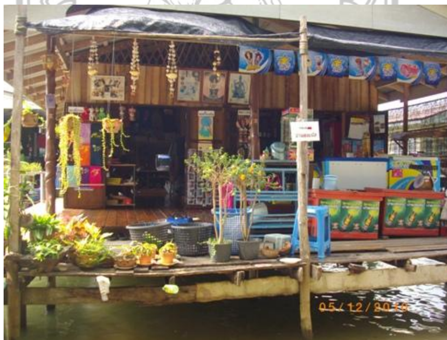
ภาพ 29 แสดงร้านขายของฝาก