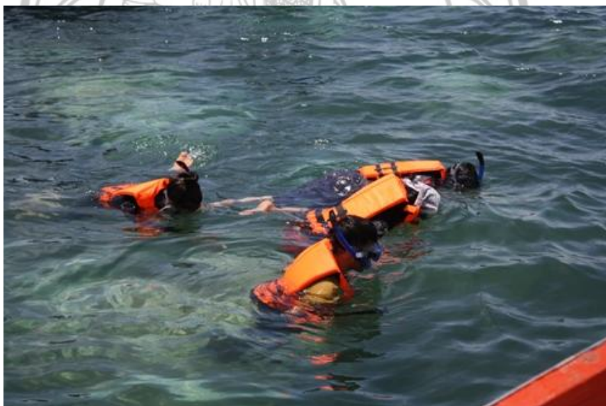
ภาพ 16 แสดงกิจกรรมดำน้ำชมปะการัง

เกาะพิทักษ์มีกิจกรรมพายเรือคายัคและเล่นน้ำ ชมทัศนียภาพของเกาะพิทักษ์เป็นกิจกรรมสบาย ๆ ที่นักท่องเที่ยวสามารถทำกิจกรรมในยามบ่าย แสงแดดกระทบลงสู่ทะเล จนสามารถเห็นพื้นทราย มีความสวยงามด้วยธรรมชาติที่อยู่รอบข้างที่สมบูรณ์ ซึ่งนักท่องเที่ยวเมื่อได้เข้าไปท่องเที่ยวสามารถติดต่อกับบ้านที่ทำโฮมสเตย์ เพราะแต่ละหลังจะมีเรือคายัคประมาณ 2-3 ลำ หากนักท่องเที่ยวต้องการใช้บริการ ชาวบ้านจะคิดค่าเช่าเรือคายัคโดยคิดค่าบริการลำละ 50 บาท ต่อชั่วโมง โดยเรือคายัคจะทำด้วยวัสดุเบา โดยผู้พายเรือจะนั่งอยู่บนที่นั่ง ซึ่งมีเบาะบาง ๆ รองรับ นักท่องเที่ยวสามารถพายคนเดียว หรือ สองคนก็ได้ หรือจะไปดำน้ำตื้น ชมแหล่งทรัพยากรทางทะเลที่สวยงาม เช่น ปะการัง หอยมือเสือและปลิงทะเล บริเวณรอบเกาะครามซึ่งอยู่ไม่ไกลออกไปจากเกาะพิทักษ์ได้ คิดค่าบริการขึ้นอยู่กับจำนวนนักท่องเที่ยว เช่น นักท่องเที่ยวจำนวน 12 - 15 คนต่อเรือหนึ่งลำ คิดค่าบริการ 700 บาทต่อเรือหนึ่งลำ หรือนักท่องเที่ยวจำนวน 18 - 20 คนต่อเรือหนึ่งลำ คิดค่าบริการ 1,000 บาทต่อเรือหนึ่งลำ