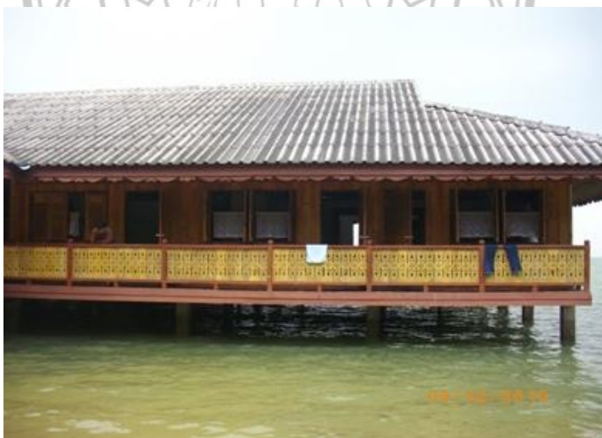
ภาพ 30 แสดงโฮมสเตย์เกาะพิทักษ์

ในการดำเนิน การจัดการด้านพื้นที่ในชุมชนเกาะพิทักษ์จะมีบ้านที่สามารถรองรับนักท่องเที่ยวในรูปแบบโฮมสเตย์ทั้งหมด 15 หลัง โดยมี 2 รูปแบบให้นักท่องเที่ยวได้เลือกเตียงคู่หรือเตียงเดี่ยว และเป็นลักษณะของการนอนกางมุ้ง โดยให้นักท่องเที่ยวนอนเรียงกันบริเวณหน้าระเบียงบ้าน ซึ่งเหมาะสำหรับนักท่องเที่ยวที่มาเป็นหมู่คณะ โฮมสเตย์ในแต่ละหลังจะมีความคล้ายคลึงกัน คือ มีโต๊ะเขียนหนังสือ โต๊ะอาหาร โคมไฟ ตู้เสื้อผ้า เป็นต้น ซึ่งในห้องจะไม่มีเครื่องปรับอากาศ เพราะโฮมสเตย์มีการก่อสร้างด้วยไม้เพื่อเป็นการรักษาความเป็นธรรมชาติและภายในตัวบ้านจะมีอากาศถ่ายเท ลมพัดเย็นสบาย เหมาะสำหรับการพักผ่อน ภายในห้องนอนจะไม่มีโทรทัศน์ไว้ให้นักท่องเที่ยว เพราะทางเกาะอยากให้นักท่องเที่ยวได้พักผ่อนได้อย่างเต็มที่ หากนักท่องเที่ยวอยากชมข่าวก็สามารถที่จะไปที่บ้านผู้ใหญ่ จะมีโทรทัศน์อยู่กลางบ้าน เพื่อที่จะให้ทุกคนได้มาแลกเปลี่ยนความคิดเห็นกันหลังจากชมโทรทัศน์ แต่ละโฮมสเตย์ก็มีความแตกต่างกันบ้านขึ้นอยู่กับเจ้าของบ้าน แต่ส่วนใหญ่มีลานบ้านที่กว้างยื่นออกไปในทะเล นักท่องเที่ยวสามารถนอนกางมุ้งบริเวณระเบียงบ้าน โดยเจ้าของโฮมสเตย์จะเตรียม ชุดเครื่องนอน หมอน มุ้ง ผ้าห่ม และพัดลม ห้องน้ำก็จะสร้างบนฝั่งเพื่อไม่ให้น้ำเน่าเสีย และไม่ทำลายความสวยงามทัศนียภาพของทะเล