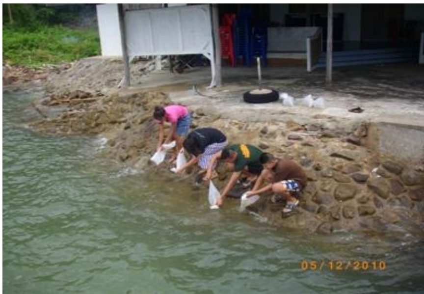
ภาพ 7 แสดงโครงการปล่อยพันธุ์ปลาลงสู่น้ำทะเล

พื้ทักษัมีควมต้งใจร่วมกันที่จะอนุรักษ์พื้ทักษัธรรมชาตให้สวย งามจนถึงร่นดูกรุ่นหลานสืบต่อไป จากการที่ชุมชนเกาะพื้ทักษั เป็นชุมชนที่ตั้งอยู่บนควมพอเพียง และค่านึงถึงสิ่งแวดล้อมจึงได้รับ คัดเลือกให้เป็นชุมชนต้นแบบเศรษฐกิจพอเพียงจากธนาคารเพื่อการเกษตรและสหกรณ์จังหวัด ชุมพร