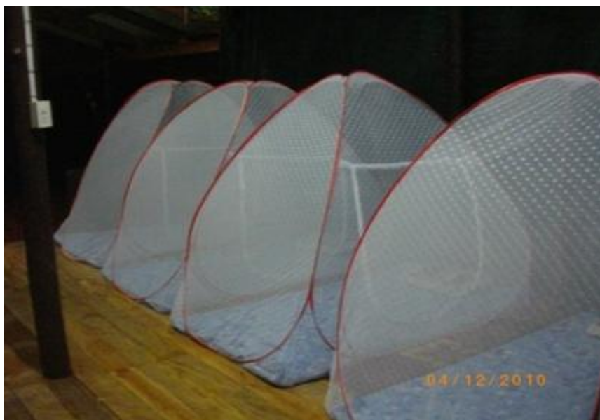
ภาพ 31 แสดงการเข้าพักแบบกางมุ้งบริเวณระเบียงบ้าน