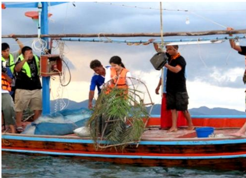
ภาพ 18 แสดงการเรียนรู้วิถีชีวิตของชาวประมงโดยการใช้ลอบ