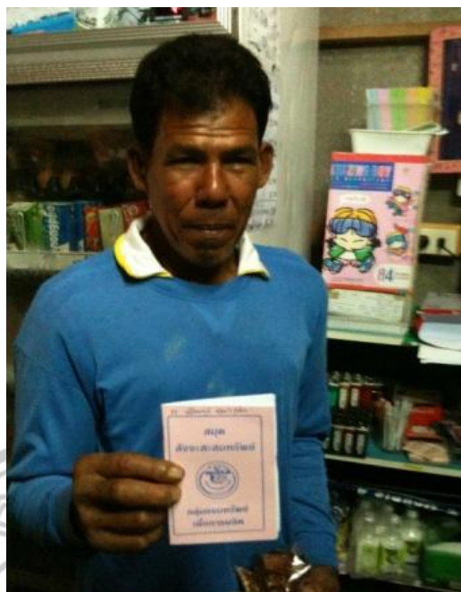
ภาพ 36 แสดงสมุดสัจจะออมทรัพย์ของชาวบ้าน