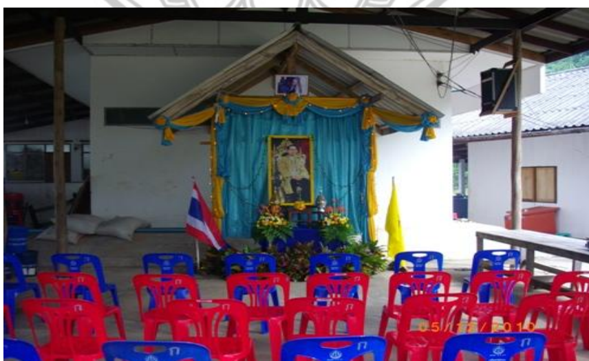
ภาพ 24 แสดงศาลาเอนกประสงค์

ปกติกลุ่มต่าง ๆ จะมีการประชุมเดือนละ 1 ครั้ง ที่ศาลาเอนกประสงค์ของชุมชนในการประชุมในแต่ละครั้งจะเป็นการร่วมพูดคุย แลกเปลี่ยนความคิดเห็นและทัศนคติ ร่วมสร้างมติหรือโครงการต่างๆ เพื่อประโยชน์ของคนในชุมชนหรือบางกลุ่มจะมีการจัดประชุมเพื่อจัดกิจกรรมต่าง ๆ เช่น ในช่วงลมมรสุมผ่านพ้น กลุ่มโฮมสเตย์ก็จะมีนัดประชุมเพื่อเตรียมความพร้อมที่จะให้บริการนักท่องเที่ยว โดยการนัดกันทำความสะอาดบ้าน กำจัดขยะ เป็นต้น บางกลุ่มก็จะนำปัญหาเข้าสู่ที่ประชุมเพื่อหาแนวทางการแก้ไขปัญหา ตลอดจนการประชุมเพื่อร่วมกันแบ่งผลประโยชน์ทั้งต่อสมาชิกและท้องถิ่น ได้แก่ การจัดตั้งสวัสดิการให้กับชุมชน การจัดเงินทุนช่วยเหลือในกรณีเกิดภัยพิบัติ เช่น กลุ่มโฮมสเตย์ให้เงินช่วยเหลือในด้านการเก็บขยะ กลุ่มอสมทรีพชช่วยในส่วนของการทำการประชาสัมพันธ์เกาะพิทักษ์ เช่นทำป้ายบอกเส้นทางเดินรอบ ๆ เกาะ เป็นต้น