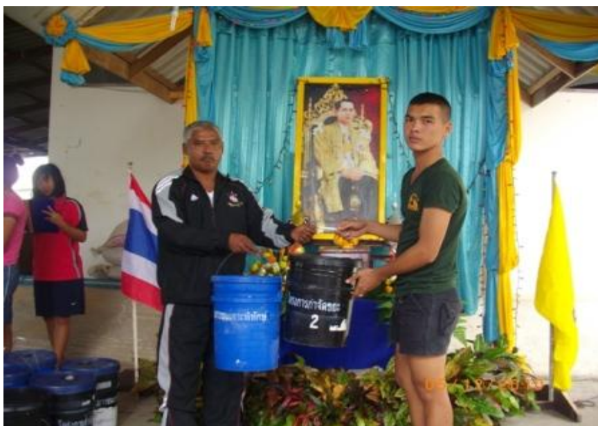
ภาพ 5 แสดงโครงการกำจัดขยะในชุมชนของเยาวชนเกาะพิทักษ์

เช่น โครงการ กำจัดขยะ มีการให้เยาวชนคิดค้นการกำจัดขยะ เนื่องจากชุมชนเกาะพิทักษ์ ตอนนี้อยู่ประสบปัญหาขยะที่มาจากนักท่องเที่ยวและขยะที่มาจากกาการพัฒนาชายฝั่งในทะเล โครงการทำป่า ปลูกบ่อเลี้ยงปลาบนเกาะพิทักษ์และป่าต้อนรับเข้าสู่เกาะพิทักษ์ โดยเยาวชนเกาะพิทักษ์จะมีการรวมกลุ่มกันหลังจากกลับมาจากโรงเรียนที่บ้านผู้ใหญ่ โดยมี ผู้ใหญ่บ้านและกรรมการชาวบ้านเป็นส่วนที่ให้การช่วยเหลือ นอกจากนี้ชุมชนเกาะพิทักษ์ยังเคยได้รับรางวัลเกาะปลอดยาเสพติด จากสำนักงานตำรวจแห่งชาติกระทรวงมหาดไทย