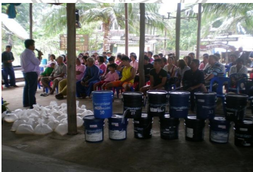
ภาพ 25 แสดงการมีส่วนร่วมในการประชุมคิดค้นปัญหา

จะเห็นได้ว่าการมีส่วนร่วมในการร่วมคิดค้นปัญหา สาเหตุของปัญหาและร่วมตัดสินใจของชุมชนเกาะพิทักษ์ ถึงแม้ว่าจะเป็นแนวคิดริเริ่มการจัดตั้งกลุ่มมาจากผู้นำชุมชนคือผู้ใหญ่บ้านที่เล็งเห็นความมีศักยภาพของชุมชนท้องถิ่น และต้องการให้ทุกคนมีรายได้จากการท่องเที่ยว ยิวเป็นรายได้เสริม โดยเริ่มจากการเรียกให้ชาวบ้านเข้ามาประชุมและทำการประชาสัมพันธ์ถึงปัญหาที่เกิดขึ้นกับชุมชนเกาะพิทักษ์ เพื่อให้ทุกคน ในชุมชนทราบถึงวัตถุประสงค์โดยทั่วกันโดยการจัดตั้งกลุ่มต่าง ๆ เพื่อให้สามารถบริหารจัดการได้อย่างมีระบบ โดยการลงประชามติ เพื่อเลือกคณะกรรมการกลุ่มในการดำเนินงาน หางบประมาณ และควบคุมการทำงานในด้านต่าง ๆ ซึ่งคณะกรรมการจะมีตั้งแต่ผู้นำชุมชนและชาวบ้าน เพื่อแบ่งหน้าที่ตามความสามารถและความเหมาะสม