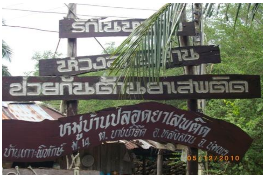
ภาพ 33 แสดงกฎระเบียบของหมู่บ้านปลอดยาเสพติด

นอกจากนี้กลุ่มโฮมสเตย์มีการวางแผนในเรื่องของที่จอดรถให้นักท่องเที่ยว โดยการติดต่อลุงชาว ที่อยู่บนฝั่งใกล้ท่าเรือรับ-ส่ง โดยรถยนต์จะมีค่าบริการคันละ 50 บาท สามารถจอดได้ 20 คัน รถจักรยานยนต์ราคาบริการ 20 บาทต่อคัน สามารถจอดได้ 50 คัน ราคานี้หากมีการติดต่อกับเจ้าของบ้าน จะรวมไปกับค่าที่พัก ค่าเรือ ค่าอาหาร 3 มื้อ จะอยู่ที่ 750 ต่อคนต่อคืน และพื้นที่จอดรถสามารถจอดรถ巴士ได้ โดยจะมีการรักษาความปลอดภัยตลอด 24 ชั่วโมง