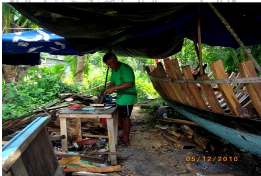
ภาพ 19 แสดงการต่อเรือที่หาตู้ได้ยาก