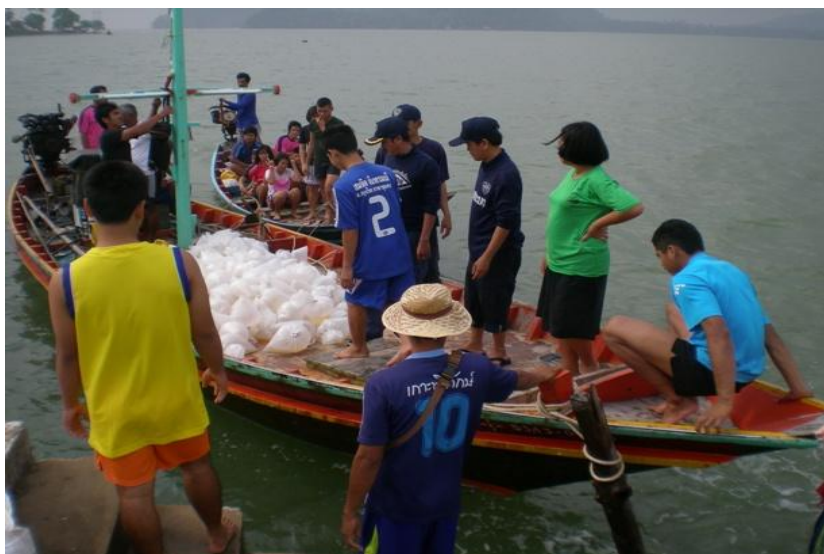
ภาพ 26 แสดงการมีส่วนร่วมในการดำเนินกิจกรรม

กลุ่มแม่บ้านแปรรูปอาหารทะเลเป็นกลุ่มที่มี การรวมตัวของแม่บ้านซึ่งปัจจุบันมี สมาชิกทั้งหมด 20 คน เป็นการรวมตัวเพื่อแปรรูปอาหารทะเลให้มีมูลค่าสูงขึ้นกว่าเดิม โดยการใช้ภูมิปัญญาท้องถิ่น และเป็นการสร้างงาน สร้างอาชีพให้แก่ แม่บ้านจากเดิมที่มีหน้าที่เลี้ยงลูกอยู่ที่บ้าน และว่างจากการทำอาชีพหลัก ในการดำเนินงานวางแผนของกลุ่มแม่บ้านจะเป็นการร่วมประชุม เพื่อกำหนดการดำเนินงานต่าง ๆ ร่วมกัน ซึ่งการดำเนินงานของกลุ่มแม่บ้านแปรรูปอาหารทะเล จะมีการดำเนินงานโดยให้สมาชิกทุกคนร่วมออม เงิน คนละ 50 - 100 บาทต่อเดือน โดยจะมีสมุด สัจจะออมทรัพย์ให้กับสมาชิกทุกคนเพื่อไว้จดบันทึกการออมเงิน และ เป็นเงินทุนในการซื้ออุปกรณ์ในการแปรรูป และมืงประมาณจากองค์การบริหารส่วนตำบลบางน้ำจืดให้ยืมงบประมาณในการการลงทุนซื้ออุปกรณ์ จำนวน 100,000 บาท แก่กลุ่ม เมื่อได้งบประมาณมา หัวหน้ากลุ่มจะ ให้สมาชิกแสดงความคิดเห็นว่าเราจะนำสัตว์น้ำมาแปรรูปอย่างไรบ้าง มีการกำหนดราคาในการขาย เพื่อให้ราคาเท่ากัน มีการประชุมเพื่อหาวัตถุดิบ ในราคาถูก ซึ่งกลุ่มจะซื้อวัตถุดิบจากชาวประมงของเกาะ เพราะจะมีราคาถูกกว่าซื้อจากที่อื่น สินค้าในปัจจุบันที่กลุ่มแม่บ้านได้ทำอยู่ เช่น กะปิ ปลาเค็มผึ่งทราย ปลาหมึกแห้ง ปลากระดังแห้ง เป็นต้น ซึ่งการแปรรูปที่ใช้กรรมวิธีแบบดั้งเดิมไม่มีสารพิษเจือปน มีการวางแผนการผลิตสินค้า เนื่องจากในแต่ละเดือนนั้น อาหารทะเลจะไม่เหมือนกัน ในบางเดือน อาจจะไม่มืวัตถุดิบ จึงต้องมีการร่วมแสดงความคิดเห็นและร่วมแก้ปัญหา ในการประชุมจะมีทุกสิ้นเดือน ซึ่งสมาชิกจะแสดงความคิดเห็น และบอกว่าในตอนนี้ได้ทำอะไรไปบ้าง เดือนหน้าจะทำอะไร เพื่อเป็นการบอกความเป็นไปในแต่