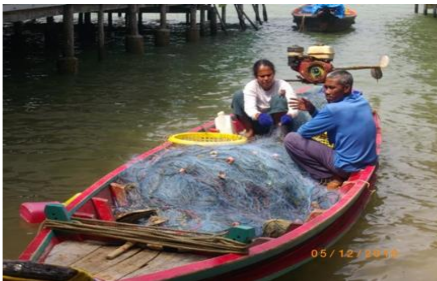
ภาพ 10 แสดงการใช้ฉนวนในการทำประมงพื้นบ้าน

ในปัจจุบันนอกจากอาชีพประมงที่เป็นอาชีพหลักของชาวบ้านแล้ว อาชีพจากการท่องเที่ยวยังทำให้ชาวบ้านมีอาชีพเสริมโดยเฉพาะแม่บ้านที่โดยปกติจะอยู่บ้านเลี้ยงลูก เมื่อมีการท่องเที่ยวเข้ามาจึงทำให้เกิดการรวมกลุ่มของแม่บ้าน คือกลุ่มแม่บ้านแปรรูปอาหารทะเล โดยมีสมาชิกทั้งหมด 20 คน ร่วมกันนำอาหารทะเลที่ได้มานำมาแปรรูปต่าง ๆ เพื่อเป็นของฝากให้กับนักท่องเที่ยวได้ซื้อกลับไป เช่น ปลาหมึกแห้ง ปลาเค็ม กุ้งแห้ง กะปิ ซึ่งได้รับความนิยมจากการซื้อเป็นของฝากเพราะมีกลิ่นหอมของ กุ้งเคียว มีการชดน้ำที่สะอาด นอกจากแม่บ้านจะขายบนเกาะพิทักษ์แล้วยังนำไปขายตามจุดต่างๆ ในอำเภอหลังสวนอีกด้วย นอกจากนี้จะแปรรูปอาหารทะเลเพื่อขายแล้ว ยังมีการทำสินค้าที่ระลึกและของใช้ในครัวเรือน เช่น สินค้าตกแต่งบ้านที่ทำมาจากเปลือกหอย ผลิตภัณฑ์เทียนเจลสวยงาม แชมพู สบู่ น้ำยาล้างจานโดยใช้สปีปะรดล้างสะอาดแล้วต้ม เสร็จแล้วนำมากรองน้ำ ผสมเกลือ และ N70 ตามสูตร เเท่านี้ก็ได้น้ำยาล้างจานที่ไม่ทำลายสภาพแวดล้อม เสื้อยืดสกรีนลายเกาะพิทักษ์ ซึ่งเป็นเสื้อที่นักท่องเที่ยวที่ได้เข้ามาจะซื้อใส่กันทุกคน เพื่อเป็นของที่ระลึกว่าครั้งหนึ่งเคยมาเที่ยวเกาะพิทักษ์