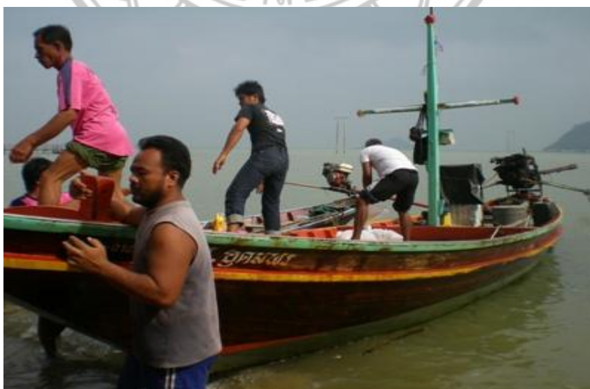
ภาพ 9 แสดงอาชีพประมงพื้นบ้านของคนเกาะพิทักษ์

...ขายให้กับนักท่องเที่ยวได้ราคาดีกว่าออกไปขายที่ฝั่ง บางครั้งนักท่องเที่ยวส่วนใหญ่ก็ให้ราคามากกว่าที่เราออกไปเสียอีก เขาให้เห ตุผลว่าอาหารทะเลสดมากๆ และอร่อย จึงให้เป็นค่าเหนื่อยบ้าง... (นพมาศ ช่วยอุดม, ผู้ให้สัมภาษณ์, 5 ธันวาคม 2553)