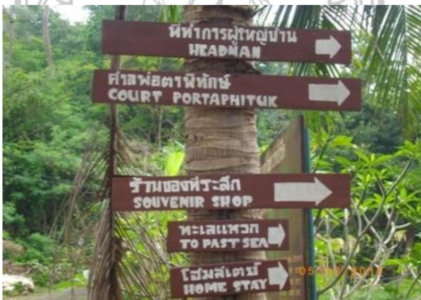
ภาพ 38 แสดงปัญหาป้ายบอกทางมีน้อย