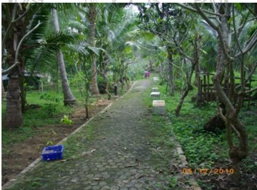
ภาพ 23 แสดงถนนตัวหนอนรอบเกาะพิทักษ์