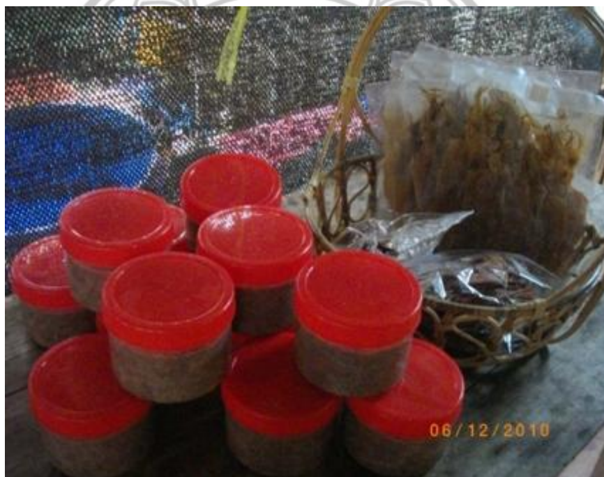
ภาพ 27 แสดงอาหารทะเลแปรรูปจากกลุ่มแม่บ้านอาหารทะเลแปรรูป

...เมื่อก่อนชาวบ้านก็จะทำอาหารทะเลแปรรูปไว้กิน ภายในครัวเรือน แต่เมื่อมีการท่องเที่ยวเชิงอนุรักษ์ที่เกาะพิทักษ์ จึงทำให้ชาวบ้านได้มีโอกาสมีรายได้จากการแปรรูปอาหารทะเลเพื่อขายให้นักท่องเที่ยวที่เข้ามาพัก จึงได้รวมตัวจัดตั้งกลุ่มเพื่อระดมเงินทุนในการทำการผลิต อีกทั้งยังร่วมกันแก้ไขปัญหาภายในกลุ่ม ไม่ต้องทำงานเพียงลำพัง... (สมวาสนา ทิพย์แสง, ผู้ให้สัมภาษณ์, 6 ธันวาคม 2553)