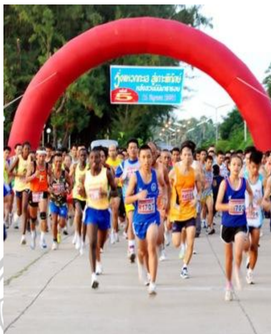
ภาพ 14 แสดงประเพณีวิ่งแหวกทะเล