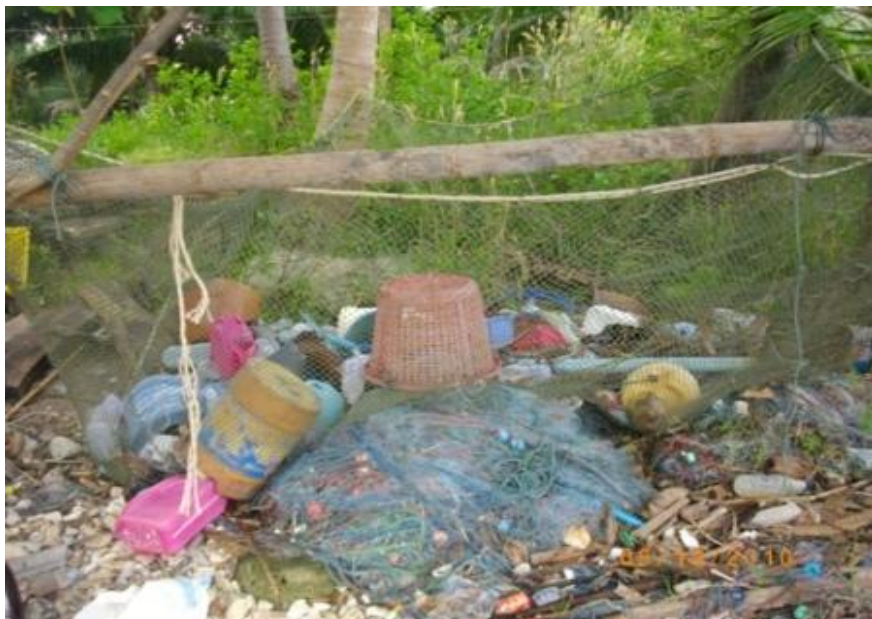
ภาพ 37 แสดงปัญหาขยะ