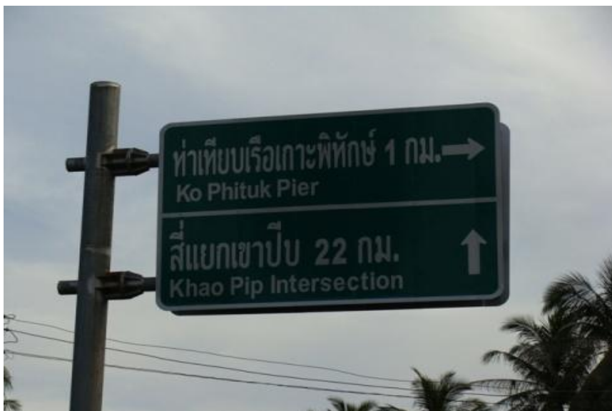
ภาพ 3 แสดงป้ายบอกทิศทาง

นอกจากนี้เกาะพิทักษ์ในช่วงน้ำลง น้ำทะเลจะแห้งทำให้เกิดเป็นสันทรายขาว ที่เรียกว่า ถนนน้ำ จึงทำให้เกิดการจัดกิจกรรม “ประเพณีวิ่งแหวกทะเล” ซึ่งกิจกรรมนี้เป็นกิจกรรมที่ได้รับการตอบรับทั้งชาวไทยและชาวต่างประเทศได้เข้าร่วมการแข่งขันวิ่ง ซึ่งจะมีการจัดการแข่งขันทุกปี ในเดือนพฤษภาคมถึงเดือนมิถุนายน อีกทั้งการเข้าร่วมรับประทานอาหารทะเลสดๆ โดยไม่คิดค่าบริการใด ๆ ทั้งสิ้น ทำให้นักท่องเที่ยวมีความตื่นตาและน่าอัศจรรย์อีกอย่างหนึ่งที่ได้มาท่องเที่ยวยังเกาะพิทักษ์อีกอย่างหนึ่ง