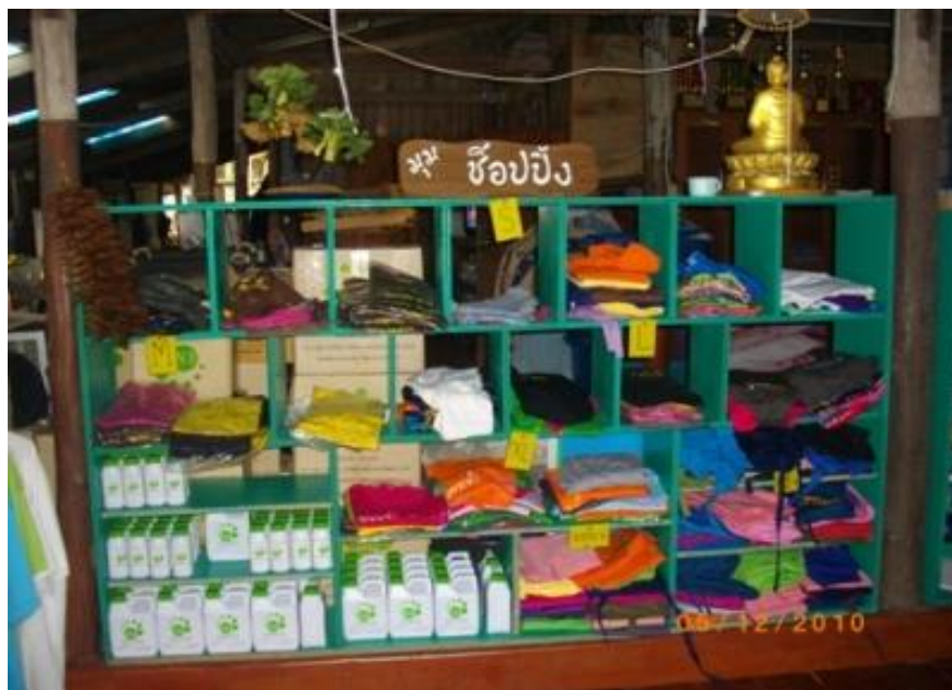
ภาพ 28 แสดงผลิตภัณฑ์จากกลุ่มแม่บ้าน