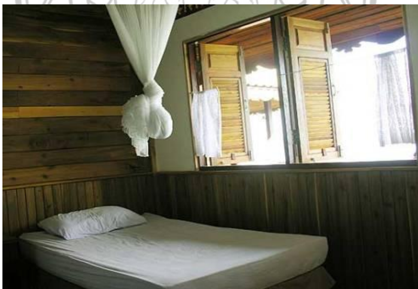
ภาพ 32 แสดงการเข้าพักแบบเตียงเดียว