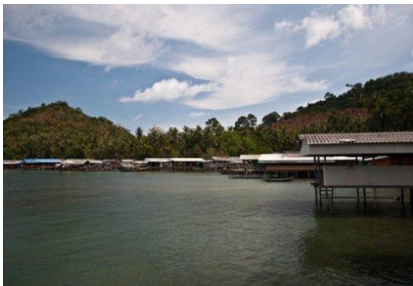
ภาพ 4 แสดงสภาพพื้นที่เกาะพิทักษ์

นอกจากนี้นักท่องเที่ยวสามารถเข้ามาชมวิถีชีวิตความเป็นอยู่ของชาวประมง การทำ อุปกรณ์จับสัตว์น้ำ ชมกรรมวิธีเฝามะพร้าว นำส่งฝั่งเพื่อนำไปทำนํ้ามะพร้าว เพราะส่วนใหญ่พื้นที่ รอบเกาะพิทักษ์จะเป็นต้นมะพร้าว อีกทั้งร่วมกิจกรรมทางการท่องเที่ยวเช่น ดำน้ำ ดูปะการังและ หอยมือเสือ การปั่นไฟล่อปลาหมึก และการตกปลา แต่สิ่งที่สำคัญที่ทำให้ เกาะพิทักษ์มี นักท่องเที่ยวเข้ามาท่องเที่ยวที่นั่นก็คือ ความมีมิตรไมตรีของ ชาวบ้าน ทุกคนในชุมชน จะยิ้มต้อนรับ นักท่องเที่ยว ให้ความช่วยเหลืออยู่เสมอ นักท่องเที่ยวจะรู้สึกถึงการอยู่บ้านตัวเอง บริเวณเกาะ พิทักษ์มีสิ่งอำนวยความสะดวกให้กับนักท่องเที่ยวตามความเหมาะสม เช่น ที่พักซึ่งจะเป็น บ้านเรือนของชาวบ้านมีลักษณะเป็นระเบียบยื่นออกนอกทะเล สามารถนอนฟังเสียงคลื่น เบบ่า มี ลมพัดเย็นสบาย อากาศปลอดโปร่งเหมาะแก่การพักผ่อน อีกทั้งห้องน้ำที่สะอาด มุ้ง หมอน น้ำประปา ร้านค้าหรือร้านขายของชำและสามารถรับสัญญาณโทรศัพท์ได้ทุกระบบ พร้อมทั้งมีการ รักษาความปลอดภัยให้กับนักท่องเที่ยวโดยอาสาสมัครพลเรือน จากความอุดมสมบูรณ์ของ ทรัพยากรธรรมชาติจึงทำให้นักท่องเที่ยวได้เข้ามาท่องเที่ยวเกาะพิทักษ์ทำให้เกิดการรวมตัว เป็น สมาชิกต่างๆ เช่น สมาชิกโฮมสเตย์ สมาชิกกลางสัตว์น้ำ สมาชิกกลุ่มแม่บ้าน โดยทุกคนใน ชุมชน เกาะพิทักษ์จะมีส่วนร่วมในการบริหารและดูแลความเป็นไปของชุมชนด้วยตนเองทำให้ทราบว่า ชุมชนมีศักยภาพเพียงใด การท่องเที่ยวทำให้ชาวบ้านได้มีงานทำโดยมีอาชีพจากการท่องเที่ยวตาม แนวปรัชญาเศรษฐกิจพอเพียงและเพิ่มความสามัคคีในชุมชนซึ่งเกิดการรวมตัวของกลุ่มยุวชนเกาะ พิทักษ์ตามมาเน้นให้มีการรักบ้านเกิดไม่ไปยุ่งเกี่ยวกับยาเสพติด ทำให้เยาวชนได้มีโครงการ ต่าง ๆ