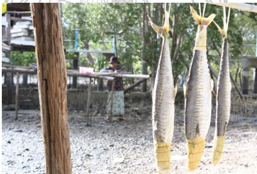
ภาพ 15 แสดงการแปรรูปปลาเค็มแบบดั้งเดิม

... อาหารแปรรูปทะเล ที่กลุ่มทำกันบ่อย ๆ ก็มี กะปิ ปลาเค็ม ปูหวาน ปลาหมึกตากแห้ง แต่บางครั้งนักท่องเที่ยวมา ตั้งใจจะซื้อปลาหมึกแห้งแต่ไม่มี เพราะตอนนั้นมันไม่ค่อยมีปลาหมึก ออกไปแล้วมันไม่ได้ ลมมันจัด ก็จะไม่ทำ เราอยากทำแล้วทิ้งไว้ไม่นาน เพราะมันยังมีกลิ่นหอมอยู่ ถ้าทำไว้ขายแล้วทิ้งไว้นาน จะไม่หอมแล้วมันจะขึ้นรา เพราะเราไม่ใส่สารกันบูด กันรา เราอยากให้ทุกคนได้กินของที่ดีและสด ... (พร ธาณีครุฑ, ผู้ให้สัมภาษณ์, 5 ธันวาคม 2553)