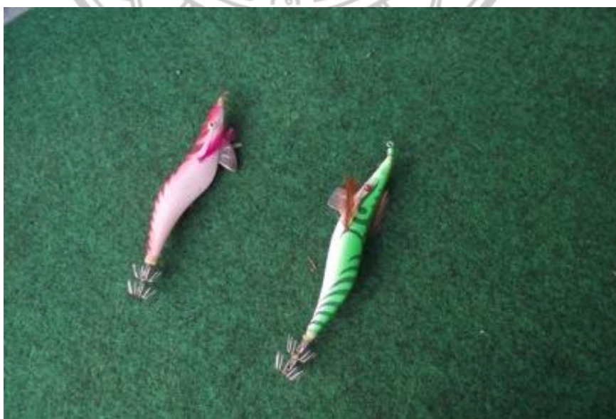
ภาพ 17 แสดงโยติกาตกปลาหมึก

... การออกเรือไป ตกหมึกที่ติดอยู่ในช่วงเดือนเมษายนถึงเดือนมิถุนายนเวลาในการออกเรือประมาณ 19. 00 น.ถึง 22.00 น. ซึ่งการตกปลาหมึกมีอุปกรณ์ในการตกคือ โยติกาหรือเบ็ดตกปลาหมึกก่อนที่จะโยนโยติกลางไป ต้องเปิดไฟที่เรือให้สว่างก่อน ประมาณ 15 นาทีเพื่อให้ปลาหมึกเล่นไฟแล้วโยนโยติการลงไป โดยไม่ต้องใช้เหยื่อ และโยติการควรรห่างจากพื้นประมาณหนึ่งช่วงแขน แล้วกระตุกโยติกาขึ้นลง เมื่อมีปลาหมึกโยติการจะหนักกว่าเดิมและกระตุกเอง... (สมพร รัตนราช, ผู้ให้สัมภาษณ์, 6 ธันวาคม 2553 )