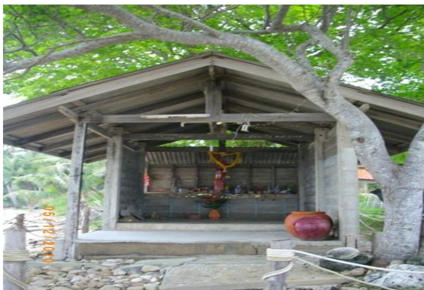
ภาพ 13 แสดงศาลเจ้าพ่อเกาะพิทักษ์

นอกจากนี้ชุมชนเกาะพิทักษ์ยังมีศาลพ่อตาเกาะพิทักษ์อันเป็นที่เคารพของชาวบ้าน เกาะพิทักษ์เพราะก่อนที่ชาวประมงจะออกหาปลา มักจะมาไหว้และบนบานศาลกล่าวและเมื่อกลับมาปลอดภัยก็มีการแก้บน จุดประทัด ถวายอาหาร เป็นต้น ซึ่งก็เป็นความเชื่อของแต่ละบุคคล