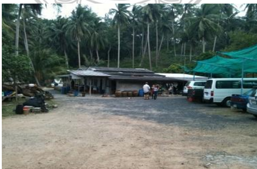
ภาพ 34 แสดงที่จอดรถของนักท่องเที่ยว

นอกจากนี้กลุ่มโฮมสเตย์มีการวางแผนในเรื่องของที่จอดรถให้นักท่องเที่ยว โดยการติดต่อลุงชาว ที่อยู่บนฝั่งใกล้ท่าเรือรับ-ส่ง โดยรถยนต์จะมีค่าบริการคันละ 50 บาท สามารถจอดได้ 20 คัน รถจักรยานยนต์ราคาบริการ 20 บาทต่อคัน สามารถจอดได้ 50 คัน ราคานี้หากมีการติดต่อกับเจ้าของบ้าน จะรวมไปกับค่าที่พัก ค่าเรือ ค่าอาหาร 3 มื้อ จะอยู่ที่ 750 ต่อคนต่อคืน และพื้นที่จอดรถสามารถจอดรถ巴士ได้ โดยจะมีการรักษาความปลอดภัยตลอด 24 ชั่วโมง