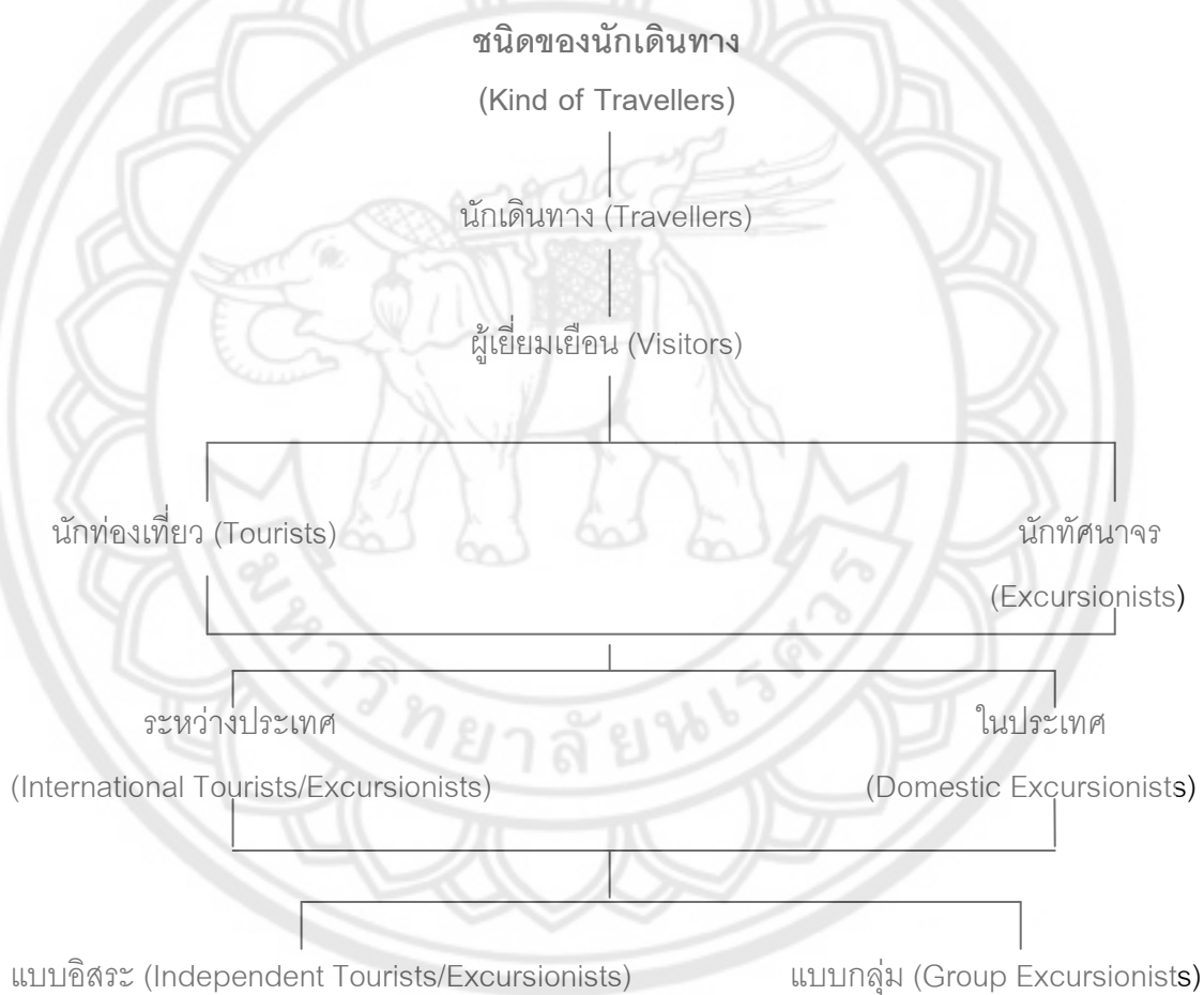
ภาพ 3 แสดงชนิดของนักเดินทาง

นักท่องเที่ยวแบบอิสระและแบบกลุ่ม อาจเลือกที่จะท่องเที่ยวโดยใช้บริการของบริษัทนำเที่ยวแบบเบ็ดเสร็จ หรือเพียงบางส่วน เช่น การสำรองที่พัก การจองตั๋วโดยสาร หรือไม่ใช้บริการของบริษัทนำเที่ยวเลยก็ได้